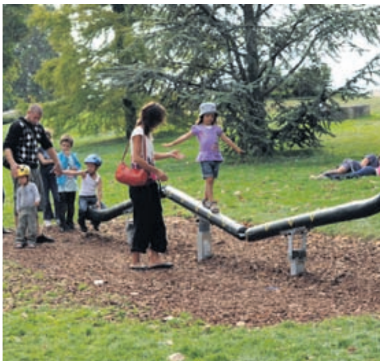
Le réaménagement provisoire des Jeunes-Rives a permis d'installer de nouveaux jeux pour les enfants.

Nous avons commencé par des travaux de génie civil dans le courant du mois de mai. Ces travaux ont