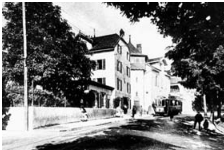
Le carrefour de Beauregard avec la brasserie de Vauseyon vers 1905...