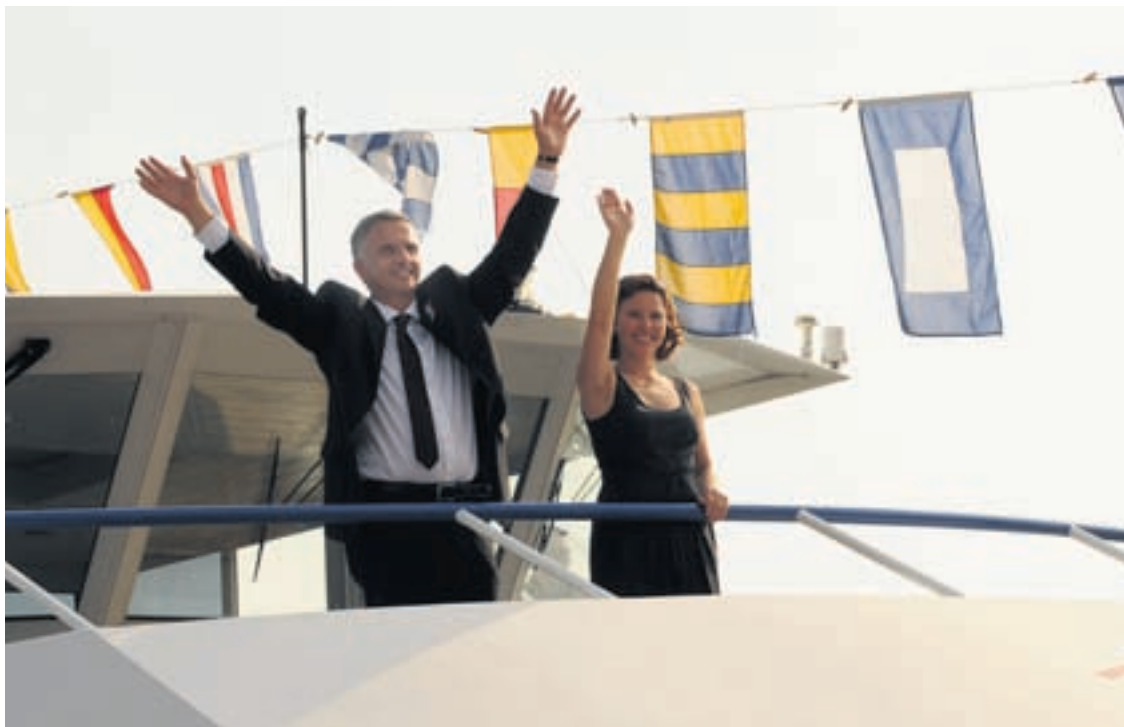
L'ancien président de la Ville reçu à bras ouverts à Neuchâtel après son élection au gouvernement fédéral.