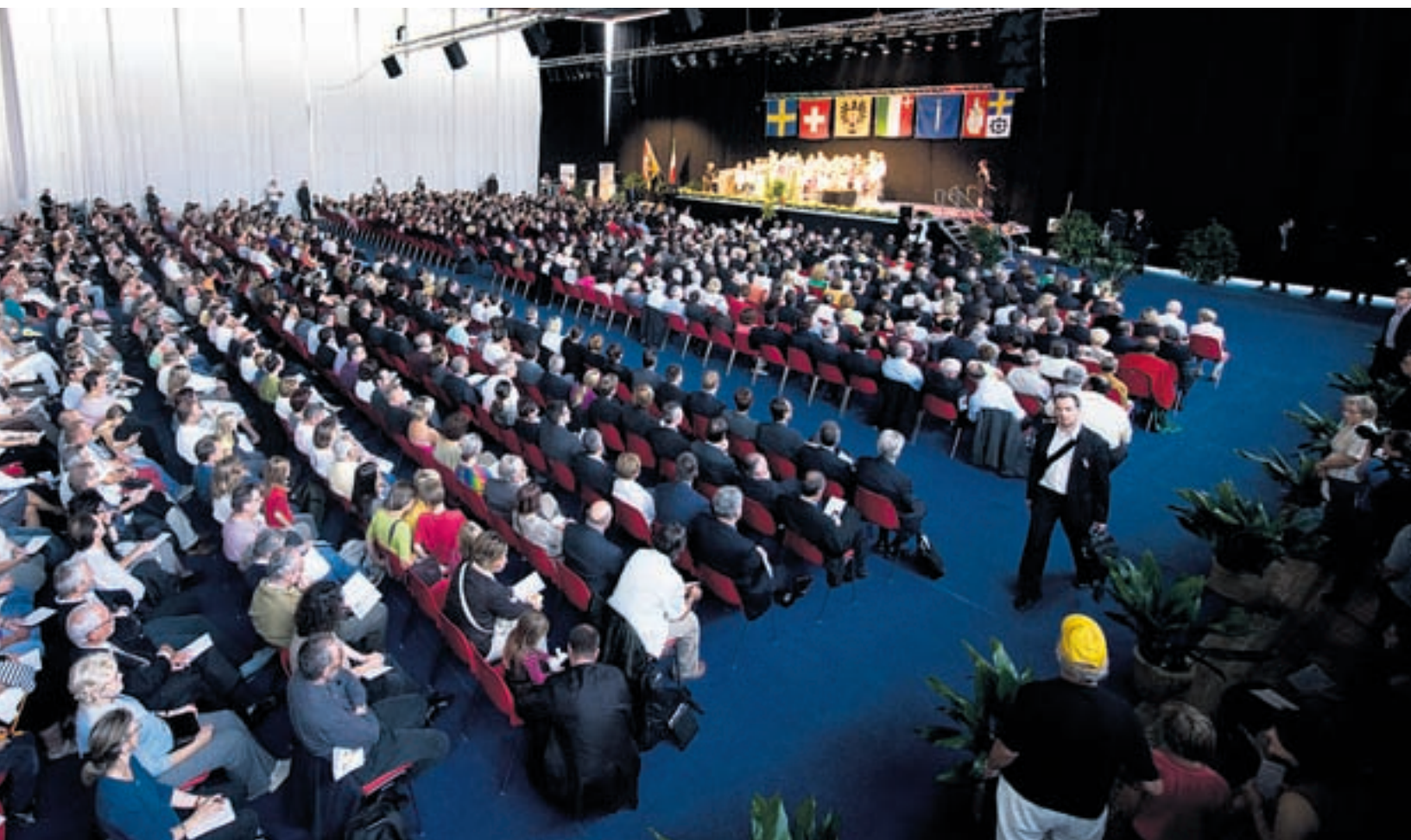
tonales et communales ainsi que de la population de la ville a fêté Didier Burkhalter jeudi passé à la patinoire.