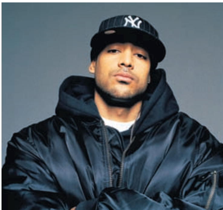
Le rappeur Booba adopte les mêmes allures que ses homologues d'outre-Atlantique.

Le rappeur Booba viendra enflammer la Case à chocs lors de la tournée de promotion de son nouvel album «Autopsie» volume 3. Déjà présent sur les deux premiers volumes des mixtapes de Booba, dj Medi Med a également mixé ce troisième volume. Booba a débuté sa carrière au sein du duo Lunatic. Depuis l'apparition de son premier album solo «Temps mort» en 2001, il ne cesse d'enchaîner les tubes. Elie Yaffa de son vrai nom, possède son propre label «Tallac Records». Le rappeur à la plume inimitable a également créé sa propre marque de vêtements «Ünkut» en 2005. Rappeur français d'exception, Booba est très prisé. «Cela faisait plus d'une année que l'on