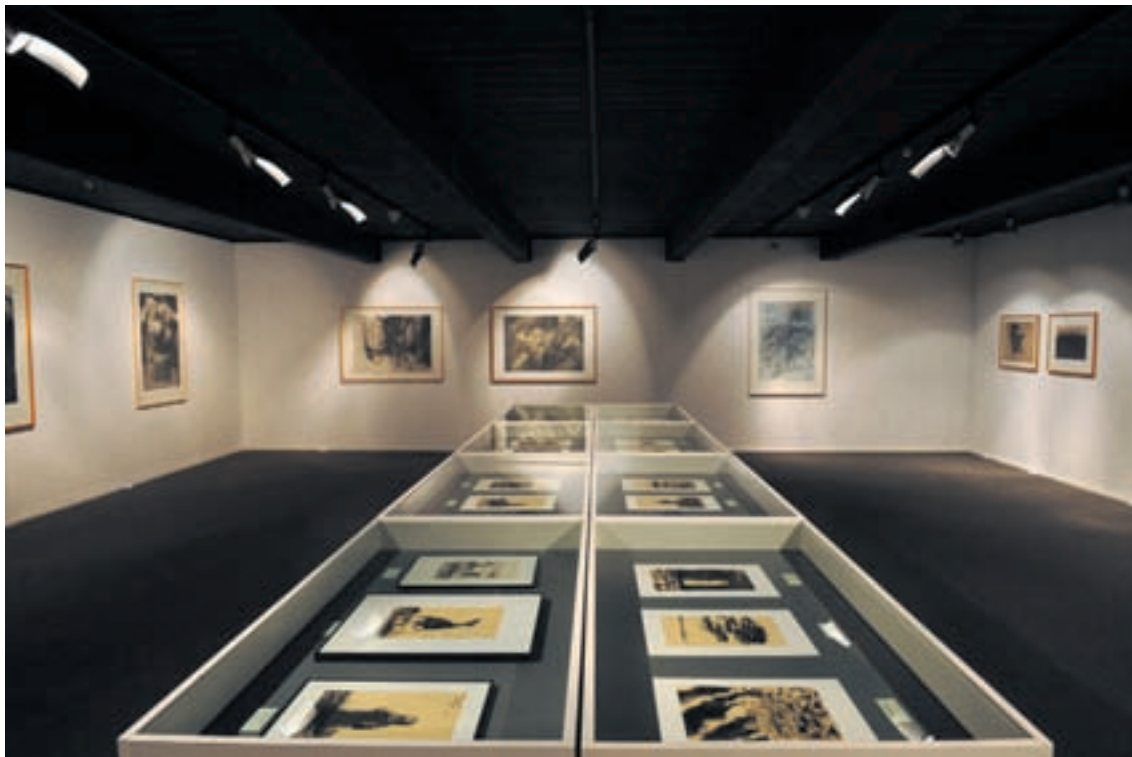
Le Conseil général a adopté une motion popvertssol priant le Conseil communal d'étudier les mesures à prendre pour inciter les jeunes adultes à fréquenter davantage les musées.