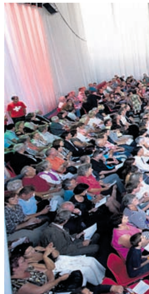
Un public nombreux composé des autorités fédérales, ca

Didier Burkhalter, conseiller fédéral, a commencé par citer Lénine: « Là où il y a une volonté, il y a un chemin ». Mon chemin à moi passe par Neuchâtel, a ajouté le nouvel élu avant de remercier la population neuchâteloise pour son soutien de même que le Parlement et le PLR pour leur confiance, et ses parents pour les années de bonheur de son enfance. Sans oublier ses fils et son épouse dont le second prénom, Friedrun, signifie le « secret de la paix ».