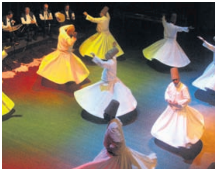
Les derviches tourneurs de Konya atteindront peut-être l'extase dimanche au Temple du Bas.

En première à Neuchâtel, Culture Nomade présente dimanche