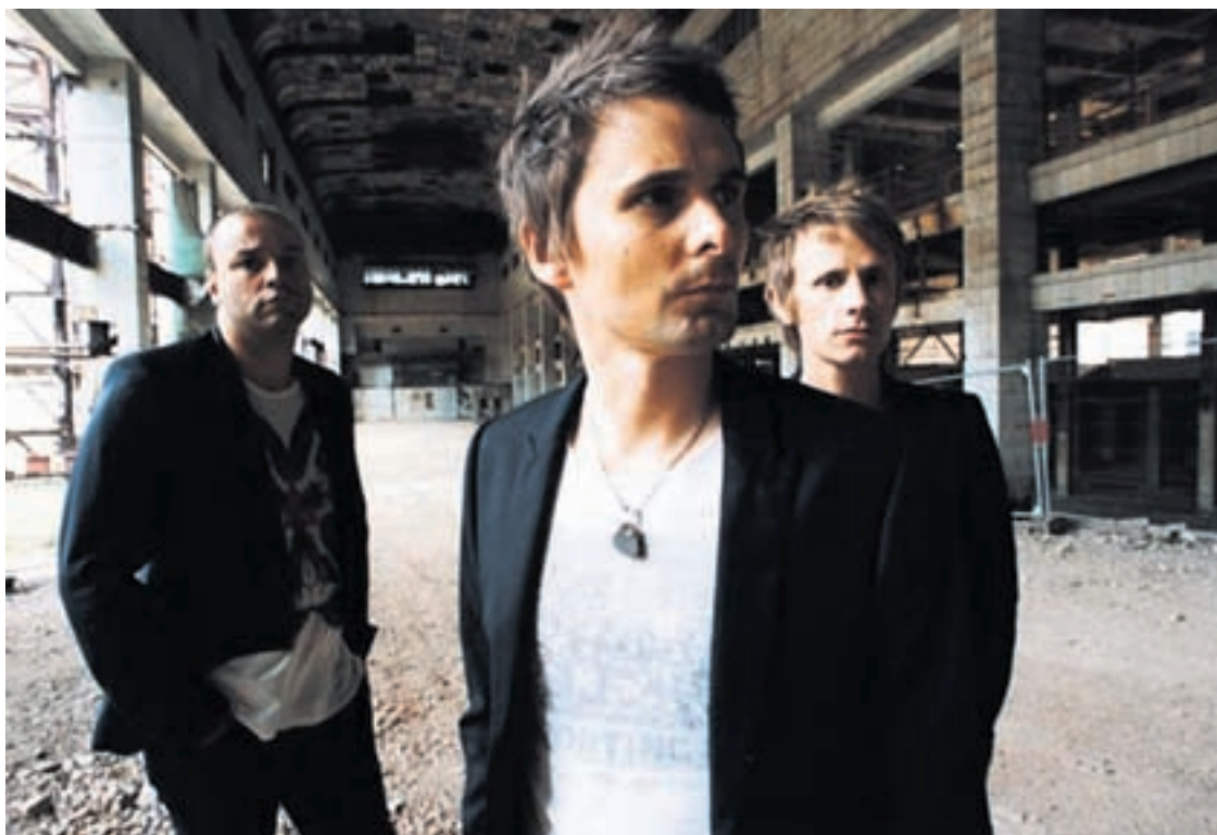
Le groupe Muse fait figure d'armoire à glace lorsqu'il joue dans les stades.

Muse n'a beau être qu'un trio, leur son est infernal ! Bon... en même temps il faut une certaine carrure pour prétendre jouer dans des stades et dans le domaine Muse fait figure d'armoire à glace. Matthew Bellamy (chant guitare et toutes sortes de claviers), Chris Wolstenholme (basse) et Dominic Howard (batterie et percussions). Ces trois petits gars viennent de Teignmouth, un bled totalement paumé, sur la côte anglaise au sud du Devon. La ville s'est développée autour d'un port de pêche pour devenir une station balnéaire à la mode pendant le règne du roi George. L'hiver les plages étant désertées, c'est donc pour combattre l'ennui que les trois poteaux, âgés de 15 ans, commencent à produire des décibels dans leur local. Nos trois teigneux débute en 1992 sous le nom de Gothic Plague, en jouant des reprises et en se produisant dans des endroits minables. Considérant que tout ce cirque fait partie intégrante de