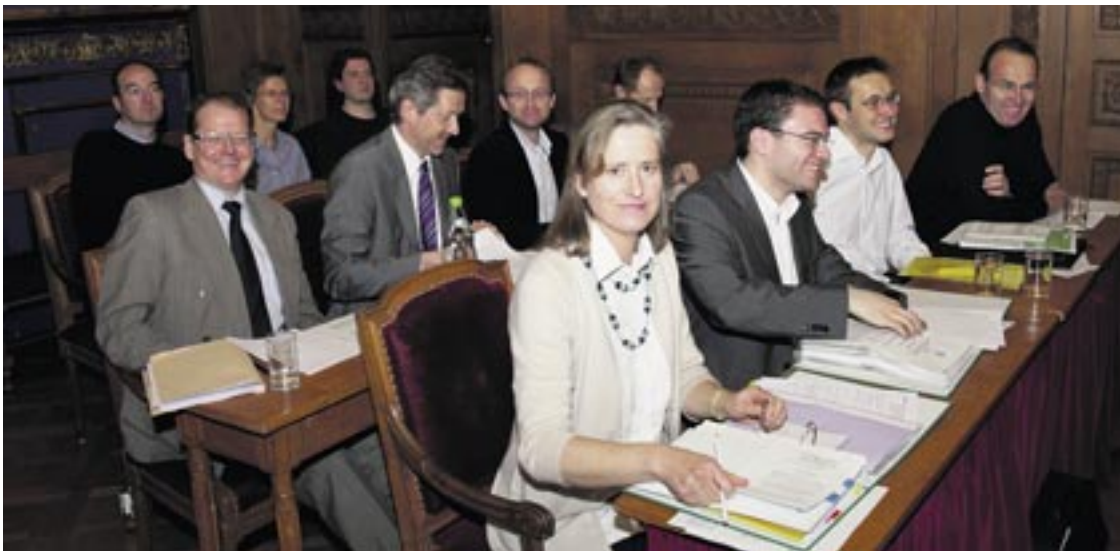
Le groupe PLR n'apprécie guère le dépassement de crédit relatif à la déconstruction de l'ancien collège de la Maladière.