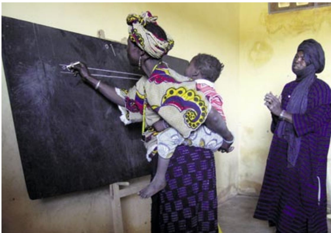
L'Association Mail-Mali met entre autre sur pied des ateliers d'alphabétisation au Mali.