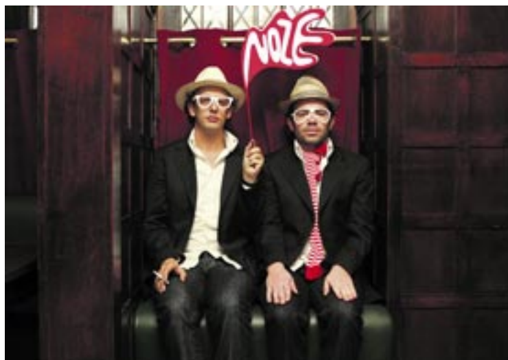
Le duo parisien Nôze se produira vendredi à une heure du matin dans la grande salle de la Case à chocs.

Jeudi soir, le spectacle aura exclusivement lieu dans la grande salle de la Case à chocs. Le trio suisse Sinner de ouvrira les feux. Dès une heure du matin, ce sera au tour de Dan le sac vs Scroobius pip de mettre le feu. Ce duo british propose une musique qui mêle beats électro et lyrisme piquant. Le vendredi soir, les artistes investiront trois salles. Le Neuchâtelois Mathieu Raetz se produira à l'Interlope.