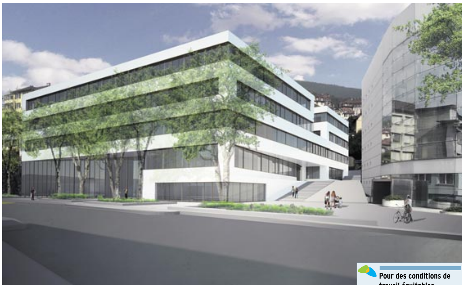
Le début des travaux du projet Microcity est prévu pour le 15 janvier avec la déconstruction des bâtiments Maladière 71 et 73.