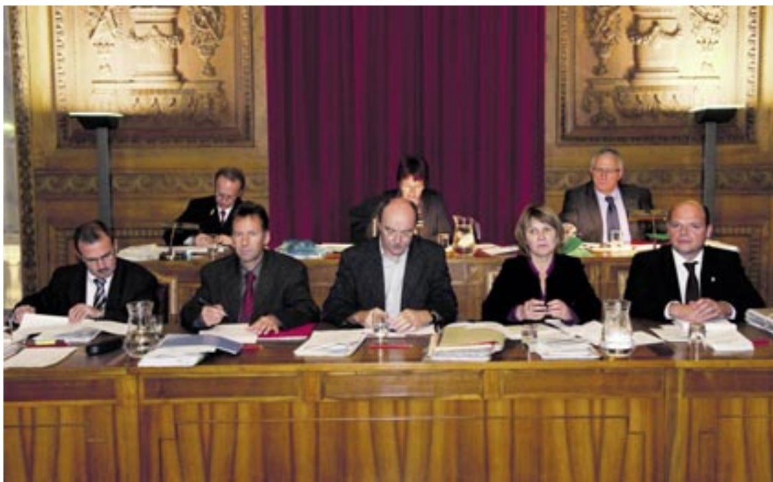
Le Conseil communal, grâce à une gestion rigoureuse, a réussi à hisser Neuchâtel en tête des villes suisses quant à leur situation financière.