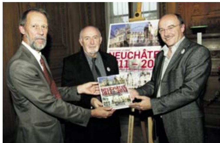
... présentation du livre du millénaire