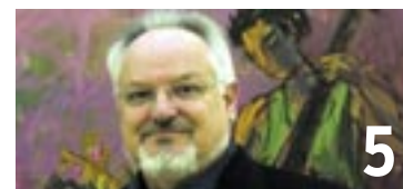
5 L'exposition «Gérald Comtesse - 50 ans de peinture» est à découvrir au MAHN jusqu'au 3 avril 2011.