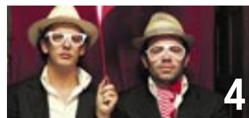
4 Le week-end électronique, la Superrette, se tiendra du 25 au 27 novembre à la Case à chocs.