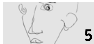
La revue annuelle de littérature et de poésie « Nomades » sort son troisième numéro.