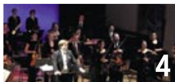
L'Ensemble symphonique de Neuchâtel se produira dimanche au Temple du Bas.