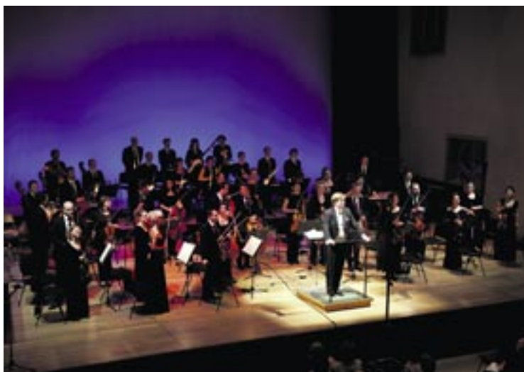
L'Ensemble symphonique de Neuchâtel donne un concert dimanche au Temple du Bas.