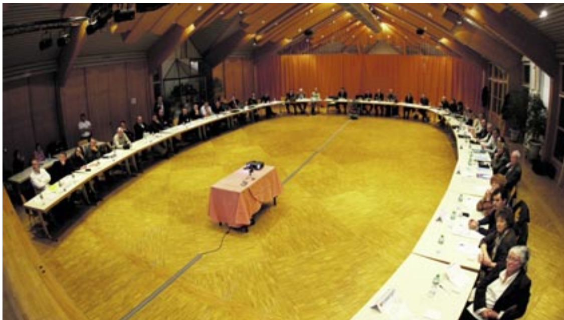
Les Conseils communaux de huit communes du Littoral neuchâtelois réfléchissent ensemble à la construction de l'agglomération.