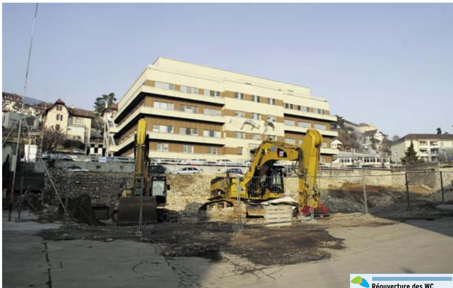
Les travaux de déconstruction de l'ancien collège primaire de la Maladière se sont terminés avant Noël.

en collège de la Maladière ont pris fin dans les temps