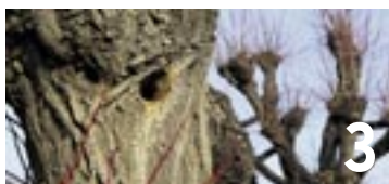
Le Service des parcs et promenades lance sa campagne d'abattage d'arbres 2011.

Enges, Hauterive, La Tène et Saint-Blaise, engagées dans un processus similaire avec les communes de l'Entre-deux-Lacs, précisent laisser ouvert à ce stade leur choix définitif. De son côté, Valangin participe au comité de pilotage mais entend poursuivre simultanément la réflexion avec les communes du Val-de-Ruz. (pn)