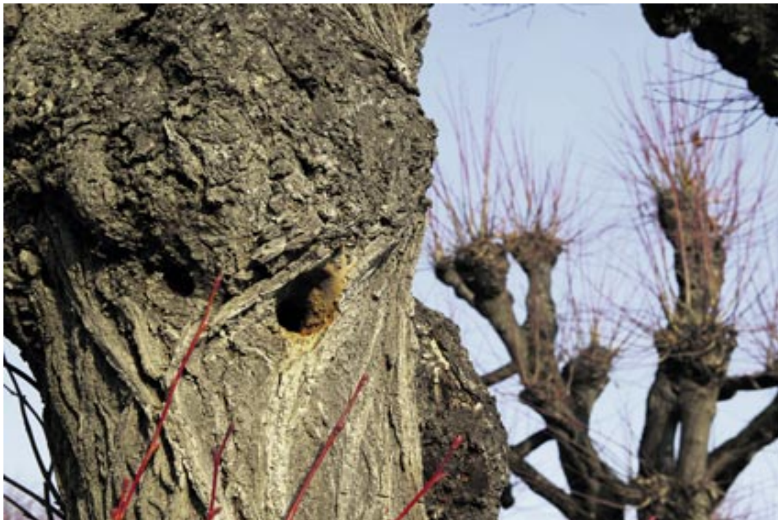
Ce tilleul, situé dans la cour du collège des Parcs, figure sur la liste d'abattage 2011. Son tronc sera conservé pour la faune.