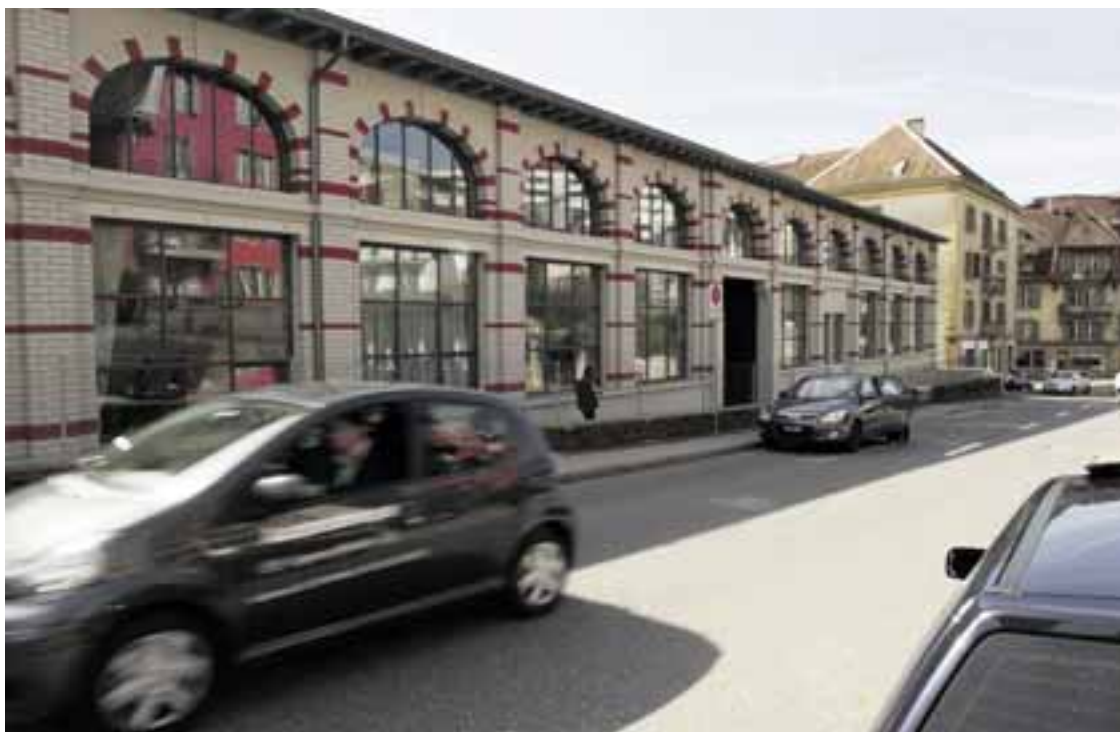
Certains habitants se plaignent des problèmes de sécurité que posent le stationnement de véhicules de parents à proximité de la crèche des hôpitaux, à la rue de Bellevaux.