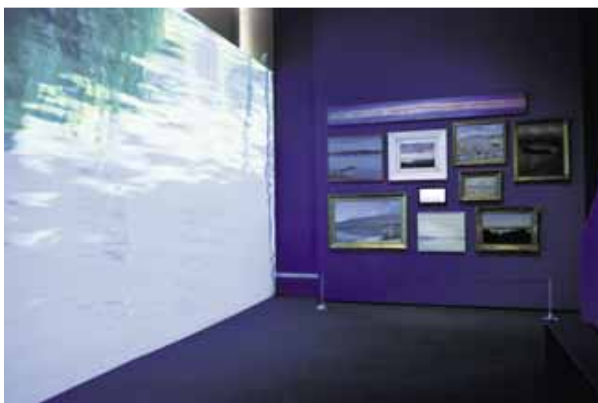
La nouvelle exposition du MAHN interroge entre autres les multiples identités de Neuchâtel.

L'exposition s'adresse à un large public. Des meubles à jeux introduisent un aspect ludique au parcours. Petits et grands auront l'occasion d'essayer des gants de chevalier ou encore de découvrir un moule de l'entreprise Suchard. Des jeux de questions-réponses accompagnent ces répliques. Des récits de vie racontés par des comédiens ponctuent l'exposition. Un faux-monnayeur, un apprenti imprimeur et un écolier, par exemple, livrent des témoignages. Le public sélectionne le récit de son choix au moyen de bornes électro-