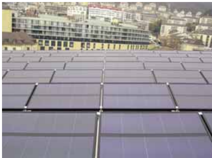
Viteos SA réalise des installations solaires photovoltaïques de technologie «silicium amorphe», comme ici sur le stade de la Maladière avec un champ de cellule d'une surface de 750 m 2 .

Aujourd'hui la Suisse produit son électricité à partir de sources renouvelables hydrauliques pour 55% de son bilan, à partir du nucléaire pour 40% et dans des centrales thermiques au gaz naturel pour 5%. Nulle trace du solaire photovoltaïque dans les statistiques nationales puisque cette filière ne contribue à couvrir que le 0,05% des besoins totaux!