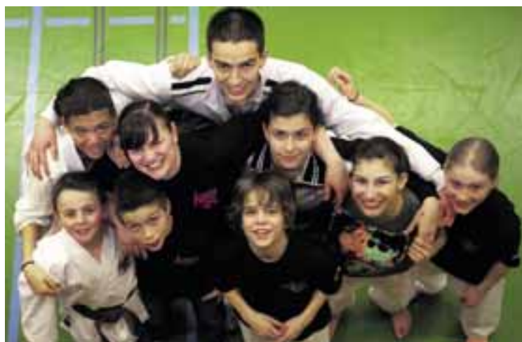
... karatékas neuchâtelois