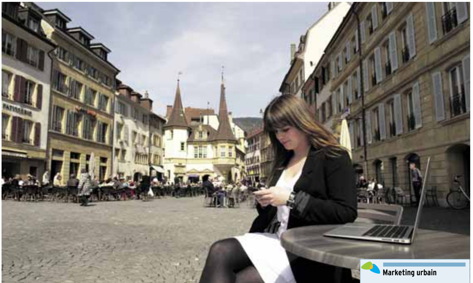
Une borne wi-fi devrait être prochainement installée à la place des Halles.