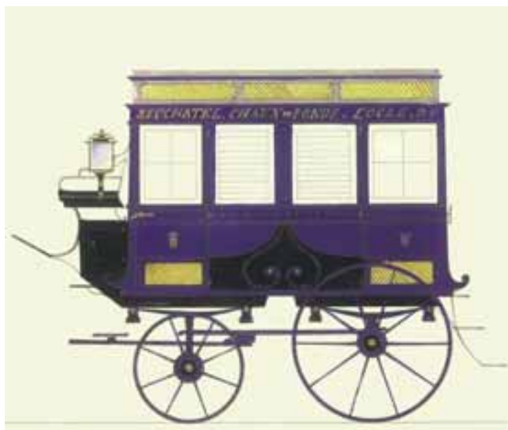
Le TransRUN des Postes de la Principauté au XIX e siècle sans rebroussement à Chambrélieu mais rejoignant La Chaux-de-Fonds en cinq heures (quatre au retour).

Ah! Les chanceux d'alors qui vivaient entièrement en zone piétonne, bien sûr boueuse, mais sans cet asphalte de 2011 qu'on voit progressivement disparaître sous une couche de chewing-gum piétiné, venu en Europe avec les libérateurs de 1944. Heureux Novumcastellois qui ignoraient la chiclette et les accumulations de mégots de cigarettes jetés n'importe où, notamment le long des voies et des quais de la gare, d'un geste détaché assez particulier, puisqu'il fallut attendre Christophe Colomb pour découvrir les vertus du tabac. Ni ces détritiques multiples, canettes, papiers, emballages dont il est si facile de se dessaisir ailleurs que