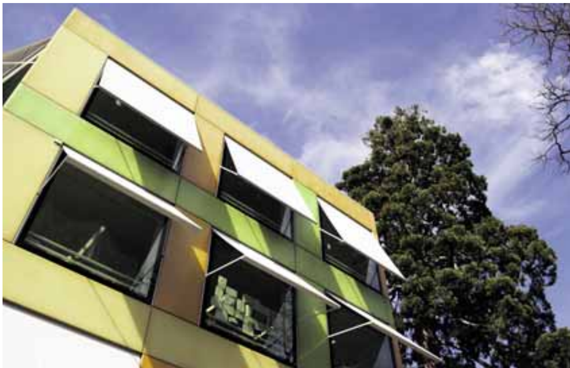
Le stand de la Ville mettra à l'honneur les bâtiments peu «énergivores», comme le nouveau collège de la Maladière.