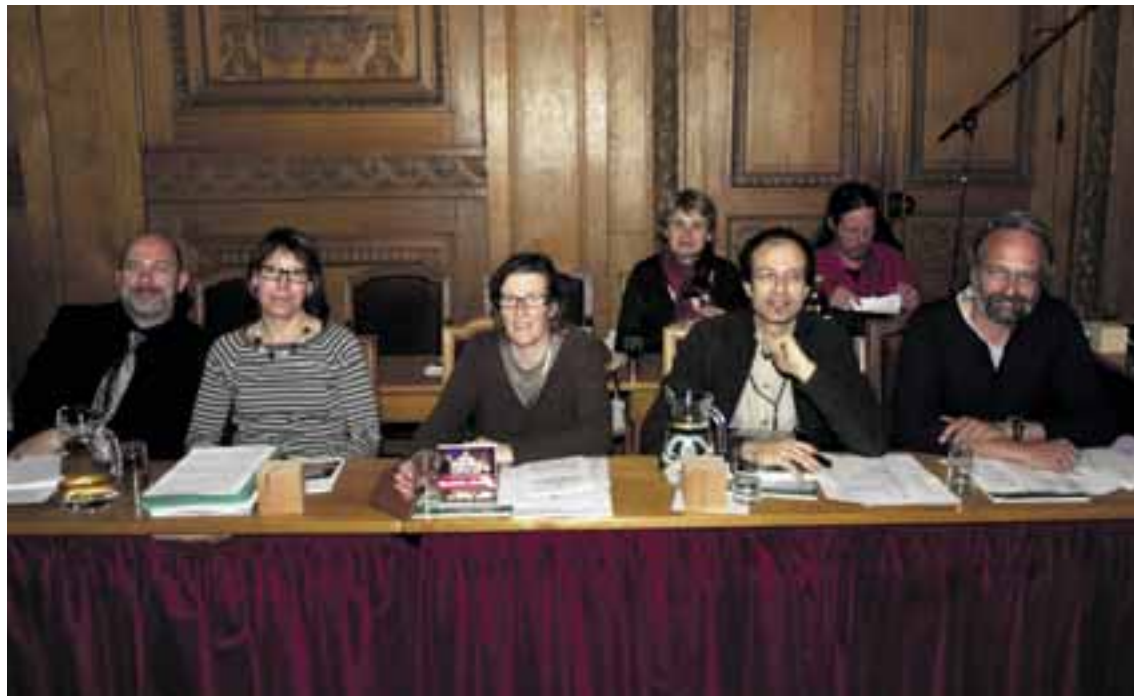
Le groupe PopVertsSol se réjouit de l'augmentation de l'offre de structures d'accueil préscolaire et parascolaire.

Dans un futur proche, notre ville disposera donc de 324 places d'accueil parascolaire à la journée entière, et plus de 200 en préscolaire. Nous sommes encore loin des buts visés mais c'est déjà un bon pas en avant. Le dossier de l'achat et de la transformation de la chapelle des Charmettes va ainsi doubler dans le bon sens. Il augmente d'une part l'offre d'accueil pour les enfants et - enfin - renverse la tendance du Conseil communal qui était plutôt jusqu'ici de vendre son patrimoine immobilier.»