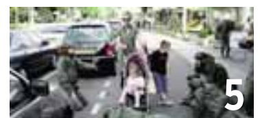
5 Micheline Calmy-Rey commémorera la Journée de l'Europe lundi 9 mai à l'Aula des Jeunes Rives.