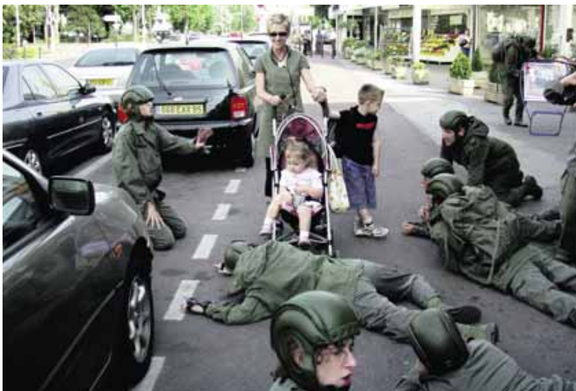
Le théâtre de l'Unité délaissera le gris-vert pour le rouge lors de son spectacle de rue décoiffant sur le parvis de l'Hôtel de Ville.

Le regard se fera ensuite prospectif, avec un débat sur les regroupements territoriaux en discussion à Neuchâtel. Le président du Conseil d'Etat Claude Nicati parlera des fusions de communes, le maire de Besançon Jean-Louis Fousseret, du partenariat entre les deux villes, le président de la Ville de la Chaux-de-