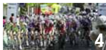
4 Le sprint final de la 3 e étape du Tour de Romandie se jouera vendredi 29 avril sur l'avenue du 1 er Mars.