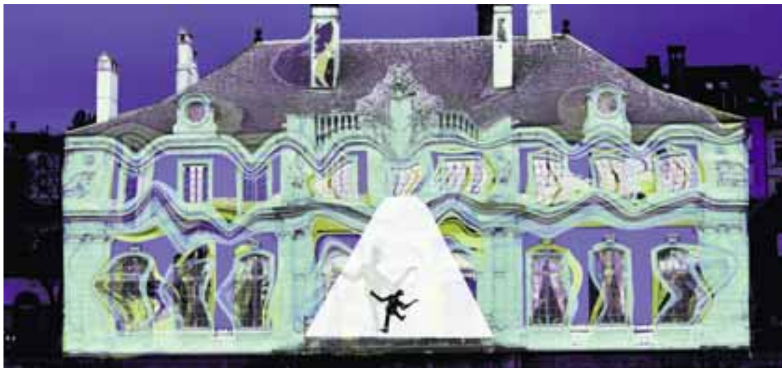
La façade de l'Hôtel DuPeyrou se déformera en fonction des mouvements du public. Spectacle sons et lumières de R. Nortik.