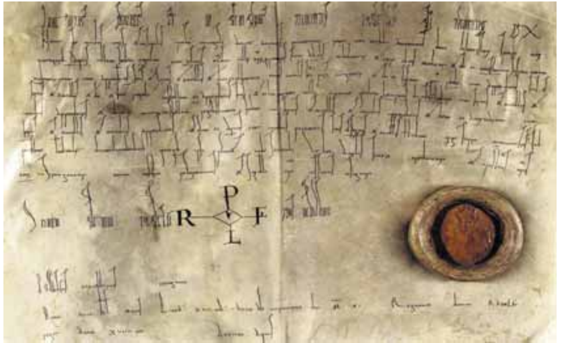
L'acte de donation signé par Rodolphe III de Bourgogne constitue la première mention écrite de la ville de Neuchâtel.