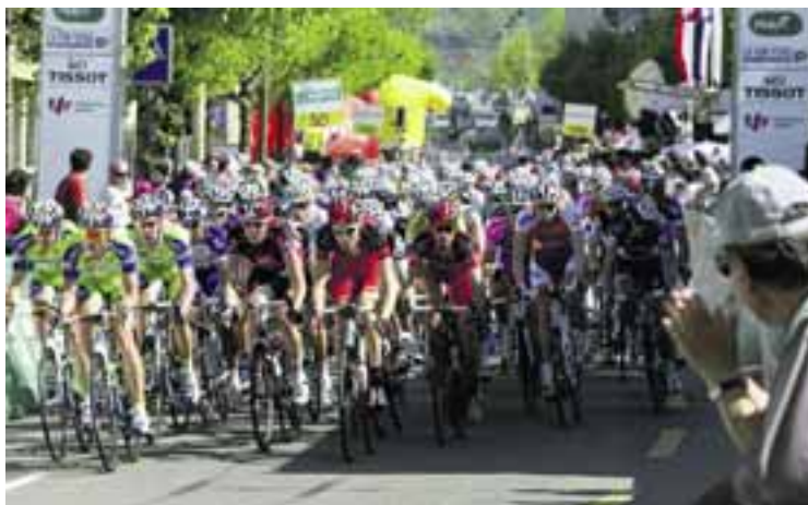
Des cyclistes en plein effort lors d'une précédente édition de la grande boucle romande.

Cela faisait 21 ans que le Tour de Romandie n'était plus passé par Neuchâtel. Les cyclistes s'élanceront à 11 heures de Thierrens dans le Gros de Vaud. Après un premier passage sur la ligne d'arrivée entre 13h45 et 14h15, ils accompliront une boucle par Saint-Blaise, Enges, Nods, Le Landeron, Cressier et Cornaux, avant le sprint final attendu entre 15 heures et 15h30. Cette étape de 167,5 kilomètres est plutôt réservée aux sprinters, explique Laurent Claude, le président du comité d'organisation.