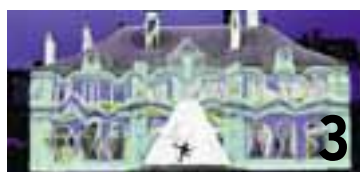
3 Les festivités du Millénaire s'ouvriront durant le week-end de Pâques, du 22 au 24 avril, au centre-ville.

Et ce n'est pas tout! La programmation associée comprend une quarantaine de manifestations culturelles et sportives qui sont présentées dans le présent numéro de «Vivre la ville», l'organe d'information du Conseil communal, renommé pour l'occasion «Vivre le millénaire» et distribué dans tous les ménages du canton. Davantage d'informations sur www.1000ne.ch (pn)