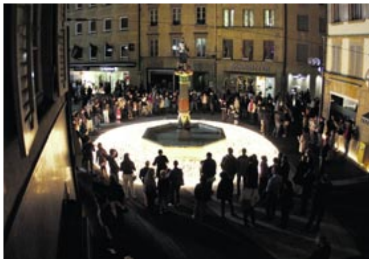
La fontaine de la Justice s'est illuminée le temps de la performance de l'artiste Muma accompagné de mille bénévoles.