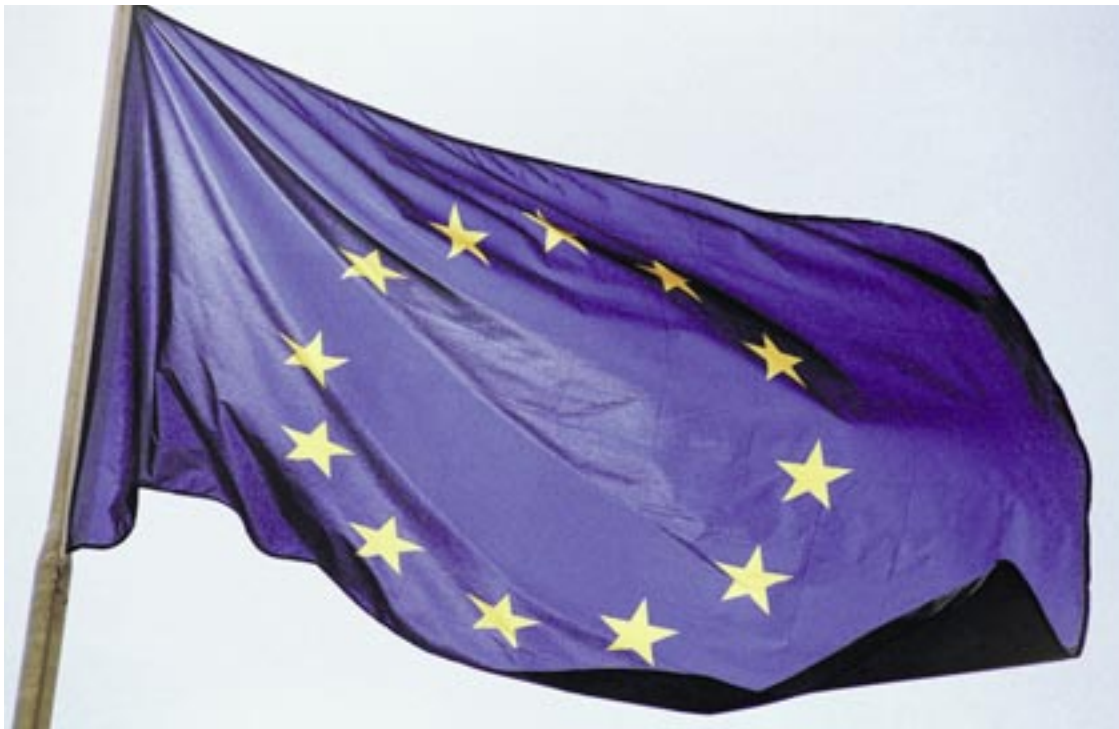
Le drapeau européen flottera sur les Jeunes-Rives.