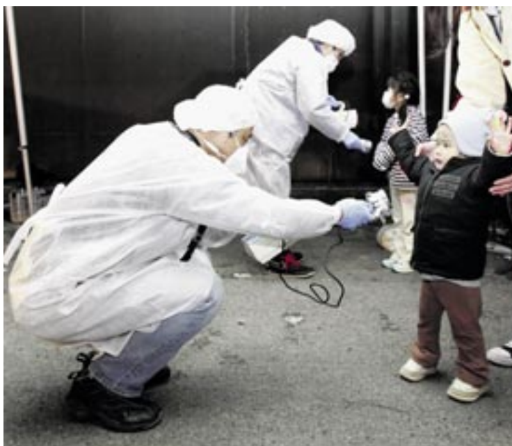
« Déplacés, contaminés, les enfants sont les premières victimes... » • Photo: Kim Kyung-hoon / Reuters

Ce n'est pas le dernier Manga ou le futur scénario de Terminator 18, mais bel et bien la réalité... Et oui... l'Homme est parvenu à créer une machine infernale. Lorsqu'elle s'emballe plus rien ne l'arrête... La marmite surchauffée et boum! Résul-