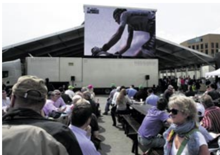
Un écran géant a permis au public de suivre la 3 e étape du Tour de Romandie en direct à la place du Port.