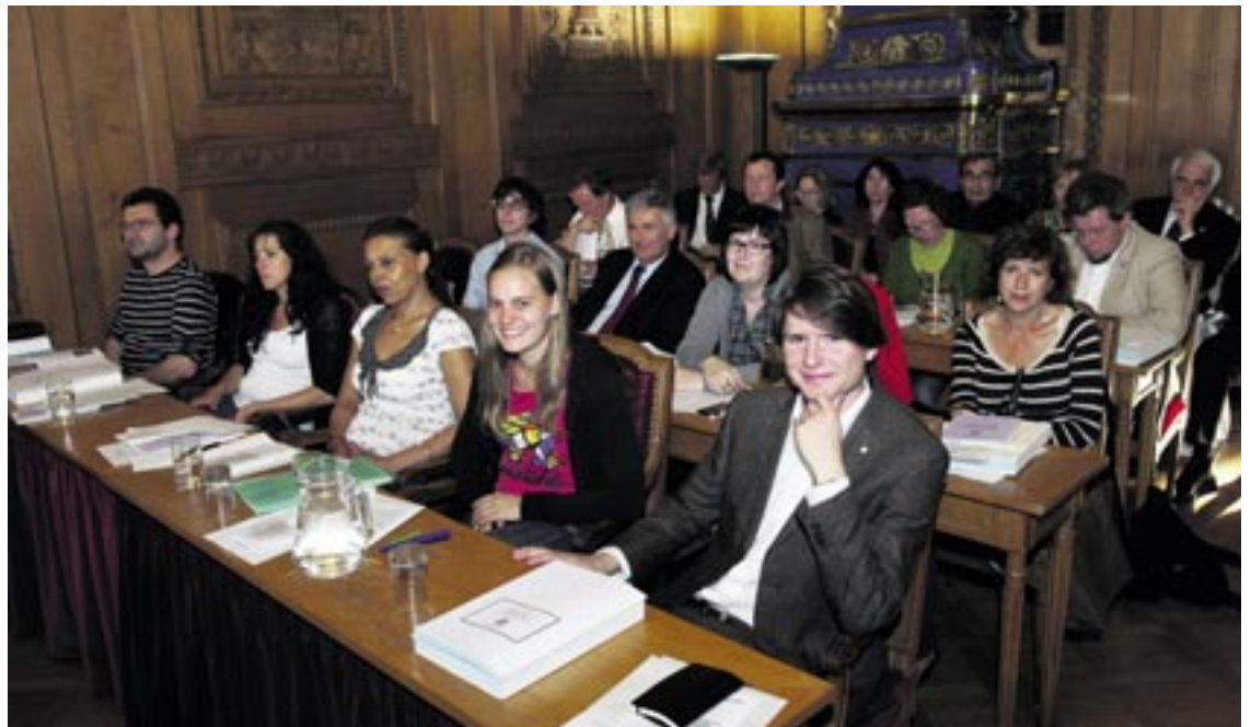
Le groupe socialiste relève que l'enjeu fondamental pour l'avenir de Neuchâtel réside dans la fiscalité, en particulier celle des personnes morales.

Un enjeu fondamental pour l'avenir de Neuchâtel réside dans la fiscalité, en particulier celle des personnes morales. Le dynamisme de la ville de