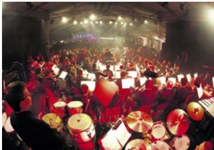
Le Wind Band Neuchâtelois s'est produit devant de nombreux spectateurs sous la tente de la place du Port.