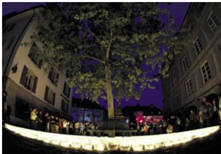
Le centre-ville brillait de 100'000 feux dimanche 24 avril, ici au Coq-d'Inde.