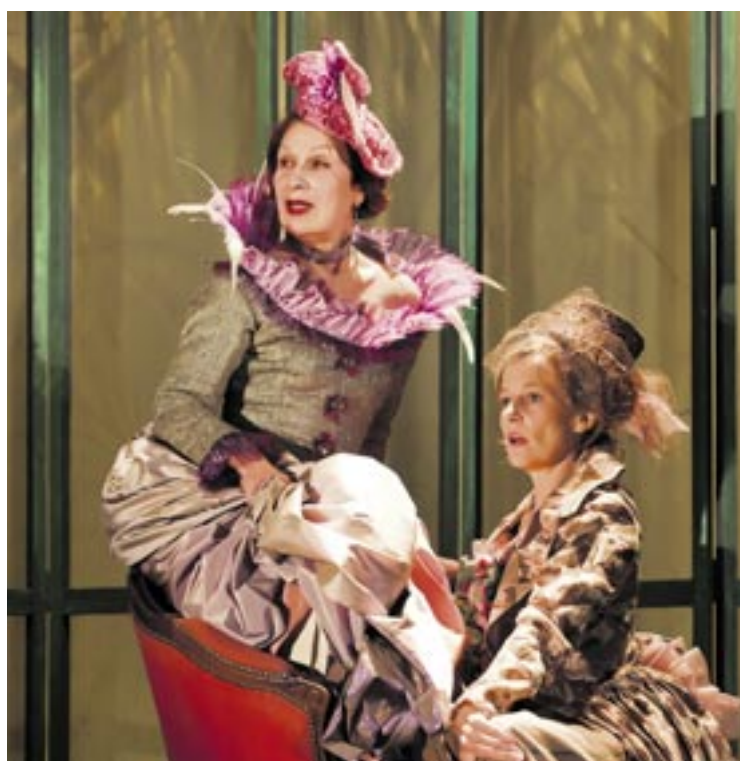
Les coups de théâtre et les quiproquos s'enchaînent dans « Les Acteurs de bonne foi ».

Dans « Les Acteurs de bonne foi », pièce de 1757, Madame Amelin, riche Parisienne venue à la campagne pour marier son neveu, demande à un valet d'organiser une comédie pour la noce.