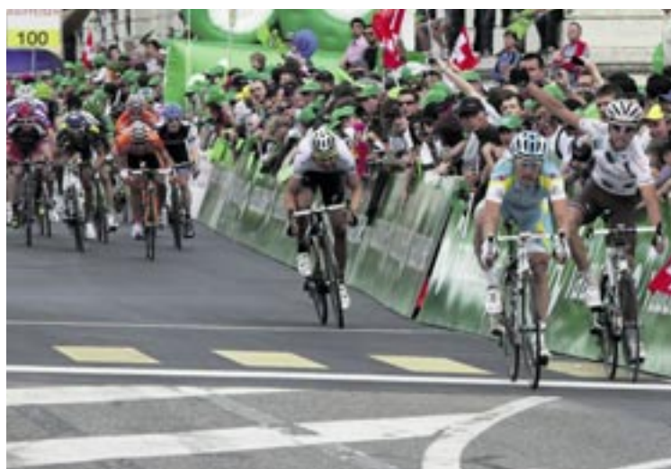
Alexandr Vinokourov (en bleu) a remporté le sprint final de la 3 e étape du Tour de Romandie le long de l'avenue du 1 er -Mars.