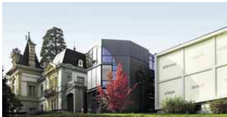
Musée d'ethnographie, Neuchâtel.