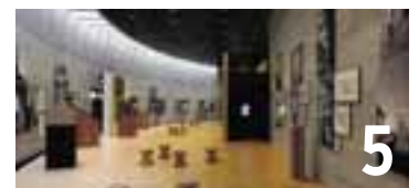
5 Les portes de la bibliothèque personnelle de Friedrich Dürrenmatt s'ouvriront dimanche 15 mai.