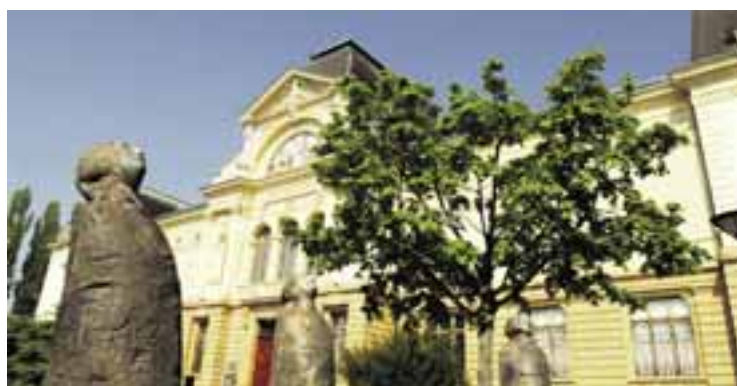
Musée d'Art et d'Histoire, Neuchâtel.