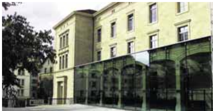
Musée d'Histoire Naturelle, Neuchâtel.