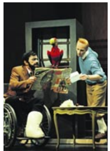
L'adaptation des « Bijoux de la Castafiore » ravira les inconditionnels de Tintin, petits ou grands.

Côté danse, le Passage accueillera en mars des champions du monde russes de hip hop dans « Davai, Davai » et une compagnie de renommée internationale, « Lalala Human Steps », en avril. Au menu figure également du ballet avec « Roméo et Juliette » de Prokofiev par le Grand théâtre de Genève, deux opéras (« L'apothicaire » de Haydn et « La fille du régiment » de Donizetti), un spectacle mariant cirque et magie (« Saga » par la Cie La Torgnole), ainsi qu'un aperçu d'un art