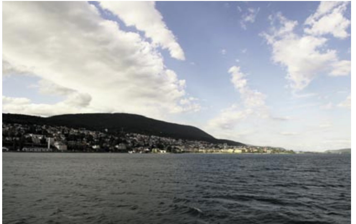
Les communes de Neuchâtel et Peseux accueillent jeudi et vendredi les délégués de l'Union des villes suisses.

Directeur des infrastructures et des énergies