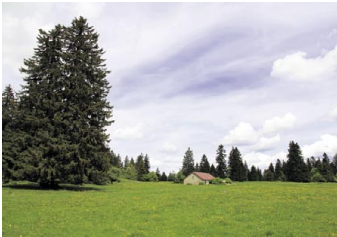
Une quarantaine de feux seront répartis dimanche 2 octobre dans le pâturage boisé du Communal de La Sagne.