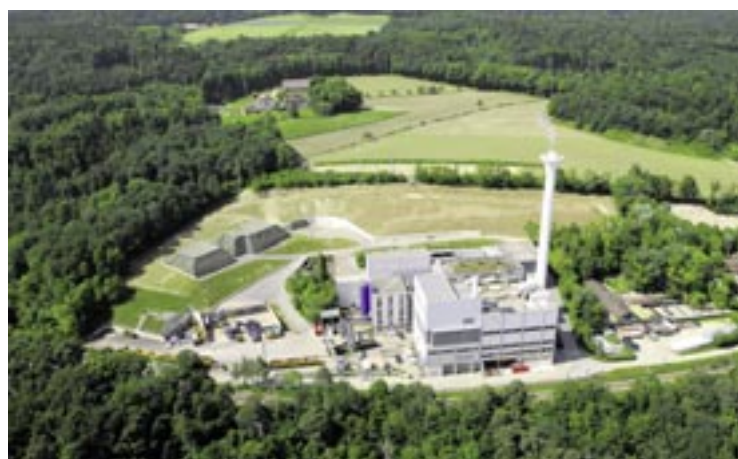
La réduction des émissions de CO 2 , bien que difficile à atteindre suite à la décision du Conseil fédéral d'abandonner l'énergie nucléaire, est un enjeu vital pour notre société (cheminée de Saïod à Colombier).

Et la situation ne va pas s'améliorer suite à la récente et excellente décision du Conseil fédéral d'abandonner la filière nucléaire en Suisse. Il est en effet à craindre que notre électricité manquante sera à l'avenir principale-