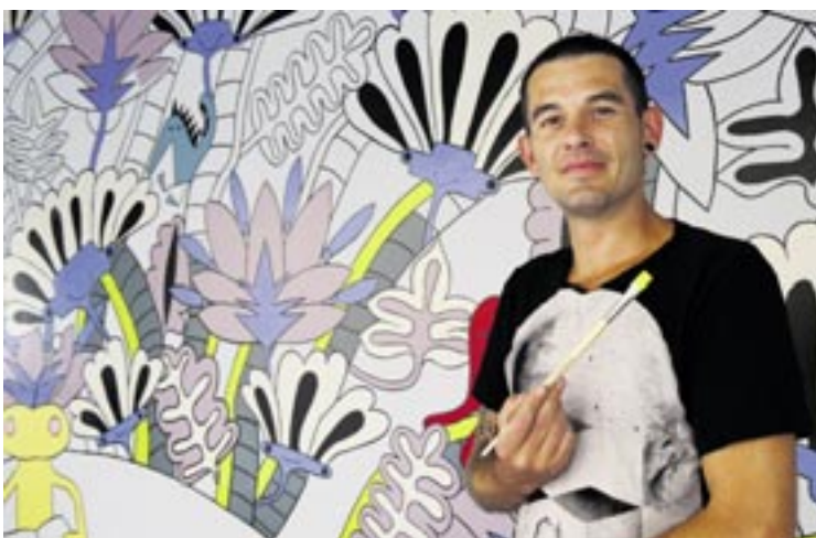
... collège de la Promenade: Jérôme et l'ère solaire