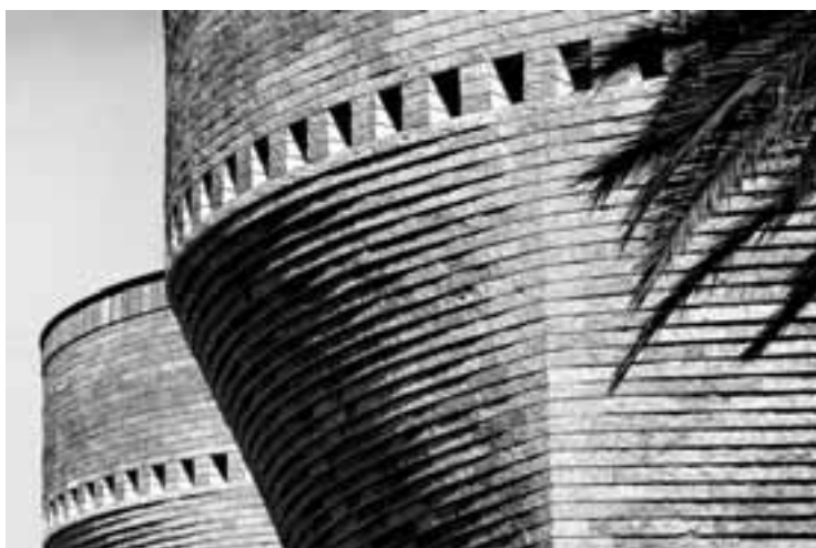
La synagogue Cymbalista de Tel Aviv

Né le 1 er avril 1943 à Mendrisio, Mario Botta est l'un des plus célèbres architectes suisses. En cinquante ans de carrière, il a signé de nombreux chefs-d'œuvre aux quatre coins du