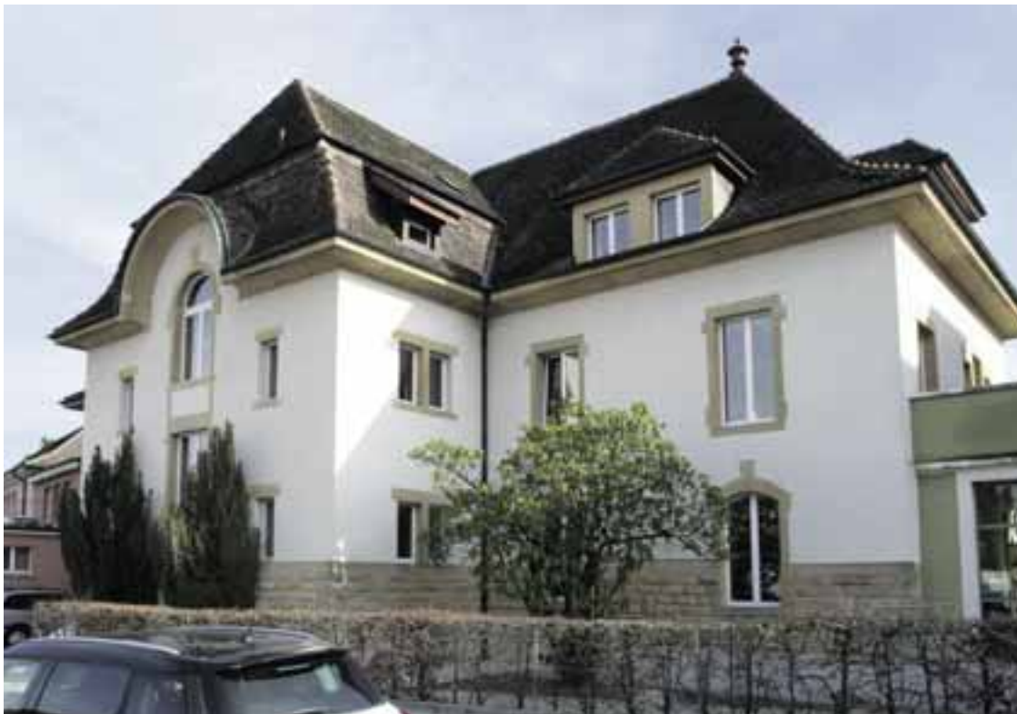
La crèche des Charmettes accueillera 30 enfants dès août prochain.