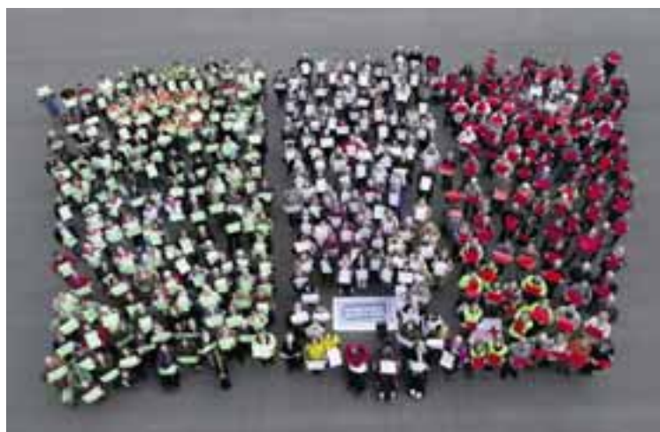
... Bénévoles neuchâtelois