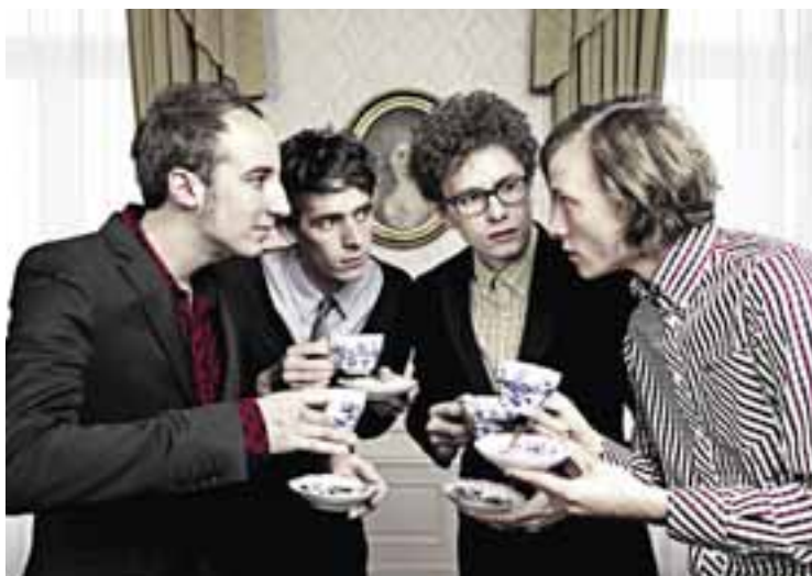
Le groupe de rock lucernois «7 Dollar Taxi» va faire monter la tension des festivaliers samedi sur la scène lacustre.

La Fête de l'Uni n'aura pas lieu cette année. Festeineuch en profite