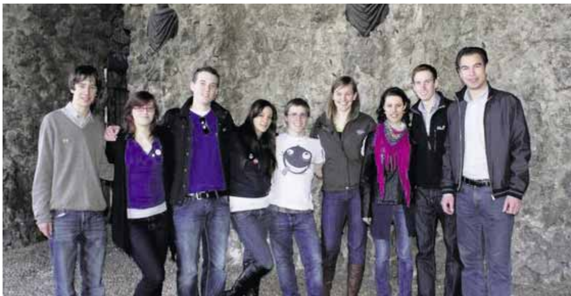
Les Parlements des Jeunes de Neuchâtel (PJNE) et de Neuburg (JUPA) lors du 10 e anniversaire du JUPA.

Le week-end du 11 au 13 mars, le PJ a participé aux 10 ans du Parlement des Jeunes de Neuburg an der Donau. Le même week-end, il a soutenu et participé à la Ipod Battle organisée par la Croix-Rouge Jeunesse à la Case à