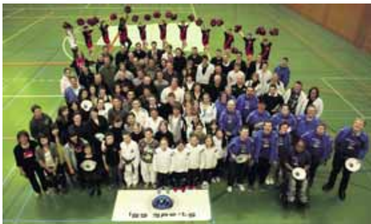
Les Autorités de la Ville de Neuchâtel ont récompensé récemment les sportifs méritants neuchâtelois de l'année 2010.