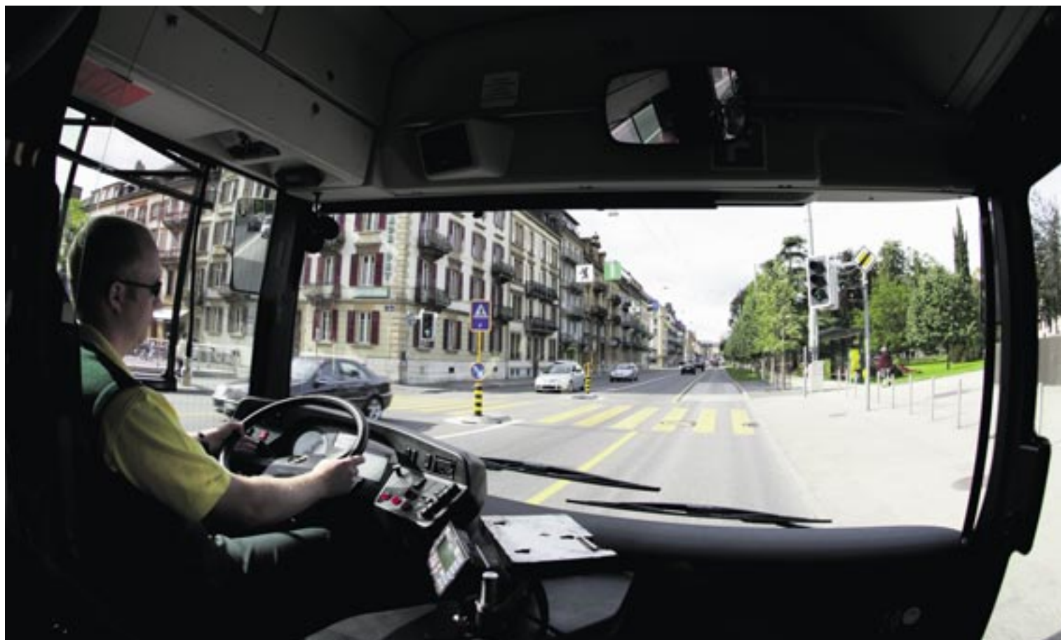
La fusion des TN et des TRN permettra d'améliorer la qualité et l'offre de transports publics.

Neuchâtelois (TN) et les Transports régionaux neuchâtelois (TRN) fusionneront au plus tard en janvier 2013