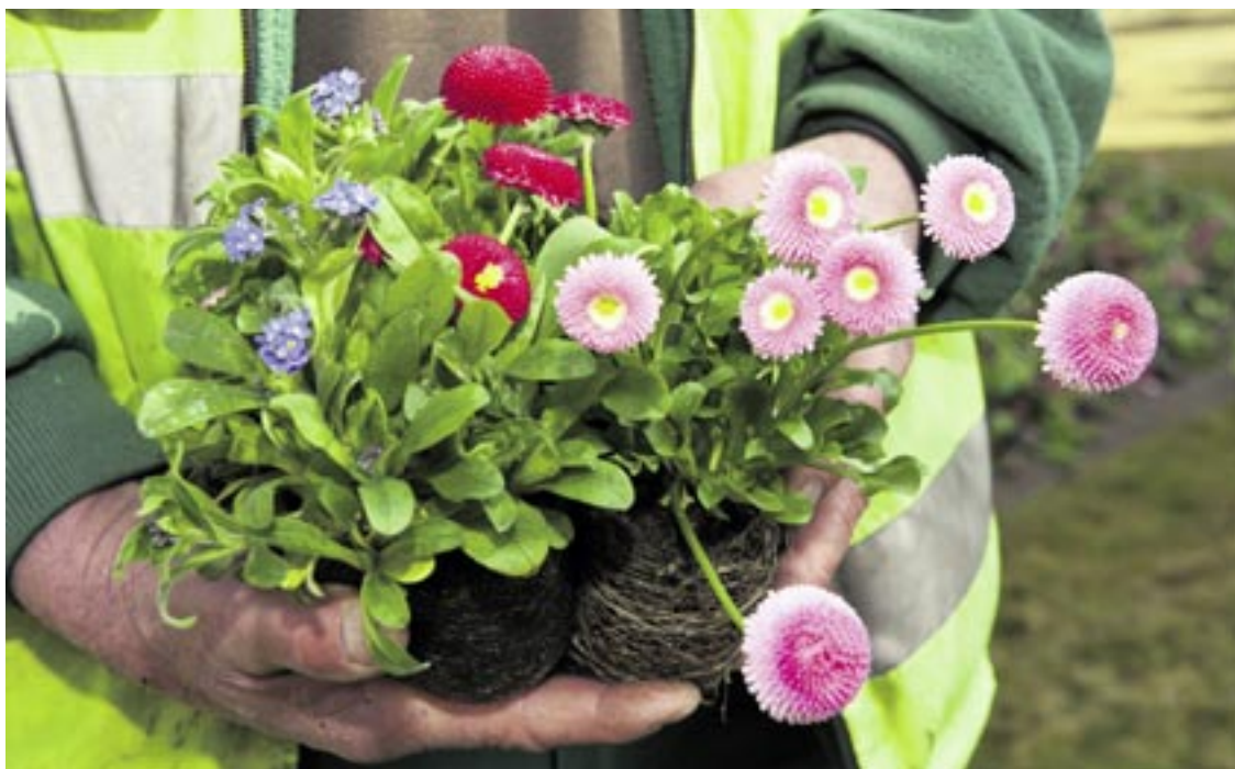
Au printemps, les employés des Parcs et promenades replongent leurs mains dans la terre.