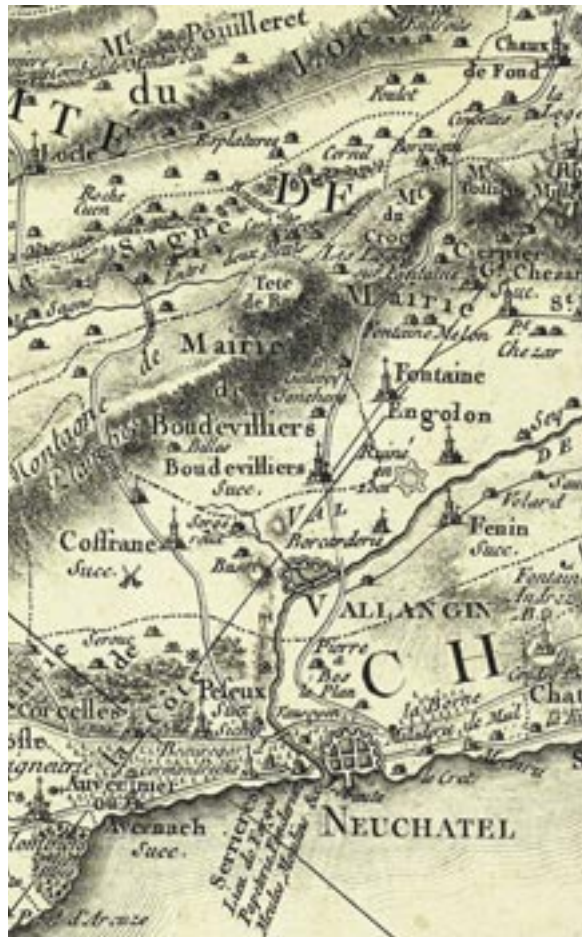
Extrait de la Carte des comtés de Neuchâtel et de Vallangin, 1779.

Sur la carte, le tracé le plus court est celui qui aboutit à La Sagne, mais peut-être n'est-il pas le plus rapide. Dans le paysage d'alors, la route devait être assez pittoresque. Au-dessus de Serrières, on y voit d'abord un premier gibet, puis après avoir serpenté dans la forêt de chênes au-dessus de Peseux, on découvre la seconde potence, celle qui, sur la