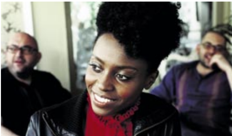
Skye Edwards se produira avec Morcheeba samedi 2 juin sur la scène du chapiteau de Festi'neuch.

Les organisateurs du festival neuchâtois ont dévoilé mardi la programmation de la 12 e édition de Festi'neuch qui aura lieu du 31 mai au 3 juin sur les Jeunes-Rives. Marilyn Manson, Sexion d'assaut, Sophie Hunger, Amadou & Mariam ou encore D-Verse City figurent parmi les artistes qui se produiront à Neuchâtel. Cette année, le festival a pris la décision de miser sur la qualité, plutôt que de se lancer dans la course aux têtes d'affiches.