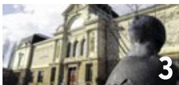
La Maison de l'Europe transjurassienne propose quatre conférences au Musée d'art et d'histoire.

A l'occasion de la Journée internationale de la forêt qui a lieu ce mercredi 21 mars, le Service communal des forêts a organisé une plantation de chênes, d'épicéas et d'autres buissons. Une classe de 7 e année du collège du Crêt-du-Chêne a planté hier dans les environs de la Roche de l'Ermitage ces spécimens provenant d'un jardin privé. La généreuse donatrice, qui avait récolté puis planté des glands dans son jardin, ne pouvait pas à long terme garder ces jeunes plants dans son jardin. (ak)