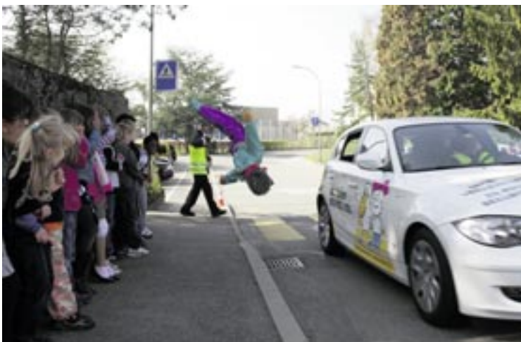
... éducation routière