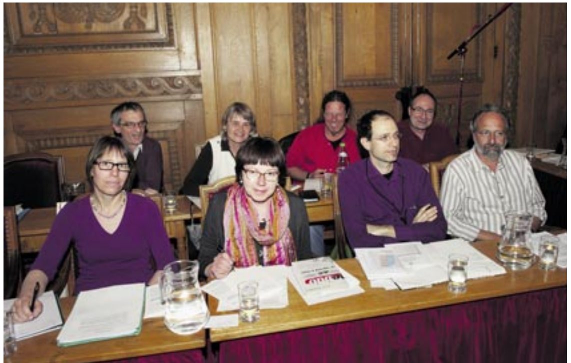
Le groupe PopVertsSol souligne les efforts déployés par le Conseil communal en vue de créer une agglomération nommée le « Nouveau Neuchâtel ».

Une première expérience a eu lieu durant les vacances d'automne 2011 et le nombre d'enfants inscrits n'a fait que confirmer la nécessité et la justesse de la motion PLR.