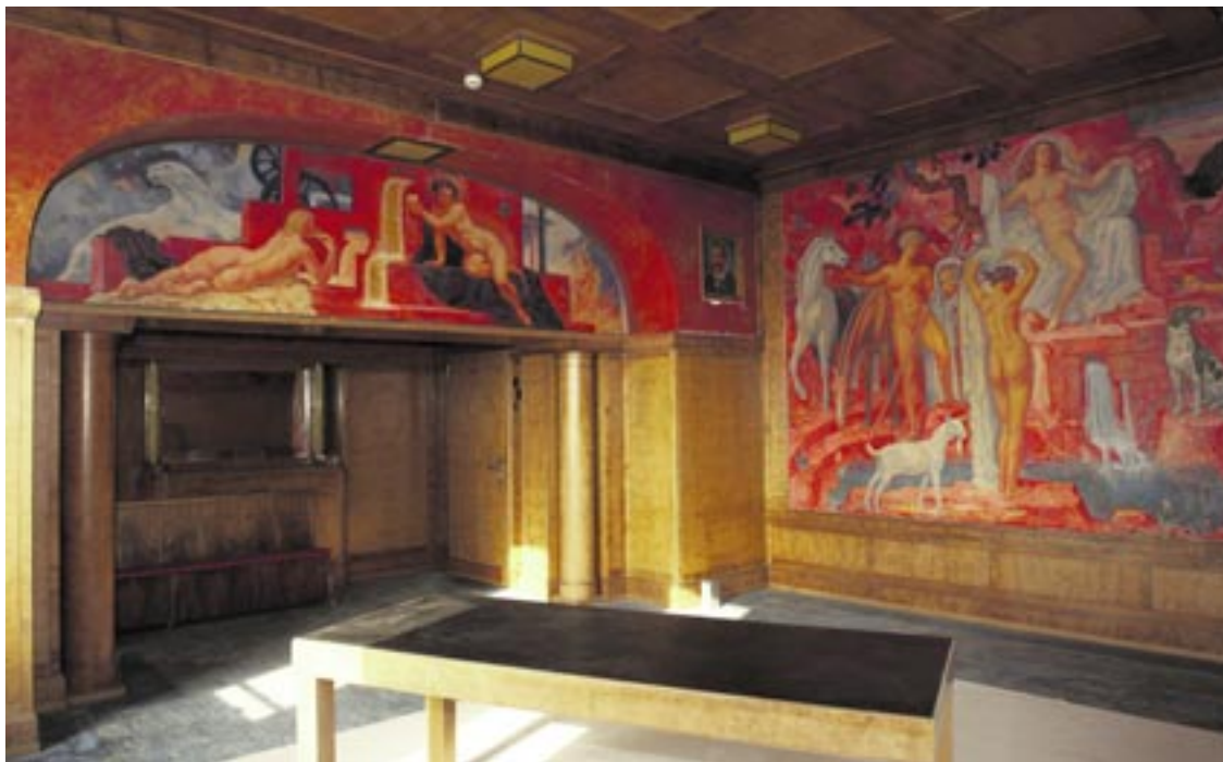
Le « Bierstübli » de l'ancienne Brasserie Müller, qui abrite quatre fresques de Charles L'Eplattenier, va être restauré.