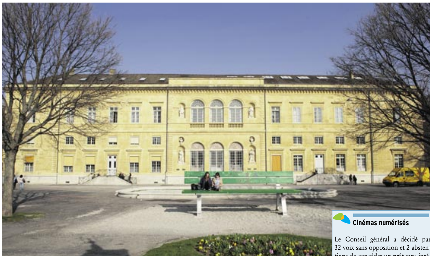
Le Conseil général n'a guère sourcillé au moment de voter un crédit de 1,2 million de francs pour refaire le toit du Collège latin.