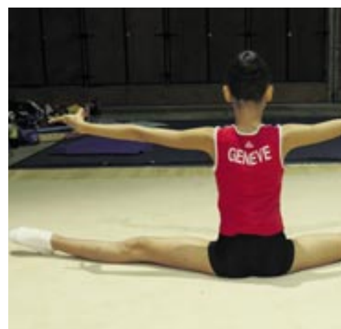
Plusieurs championnats romands de gymnastique ont eu lieu à Neuchâtel.

Six cents gymnastes se produiront samedi à la grande patinoire du littoral en compagnie de 55 musiciens du Wind Band neuchâtelois.