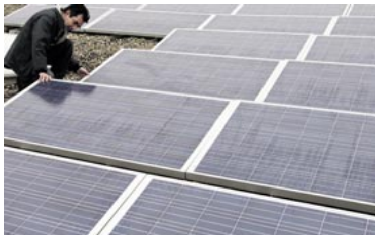
Des modules solaires photovoltaïques ont été installés sur le toit du CPLN par Viteos. Cette réalisation exemplaire est le résultat d'une étroite collaboration avec les enseignants et les étudiants de l'école professionnelle.

Une amélioration de l'efficacité ainsi que la réduction des besoins énergétiques doit rester prioritaire dans toute politique visant à une utilisation rationnelle de l'énergie. Dans ce contexte, le RVAJ regroupant les communes d'Orbe, Neuchâtel, La Chaux-de-Fonds, le Locle, Val-de-Travers, St-Imier, Bienne, Tramelan, Moutier, Delémont et Porrentruy, a rencontré un grand succès l'année dernière auprès de la population en organisant