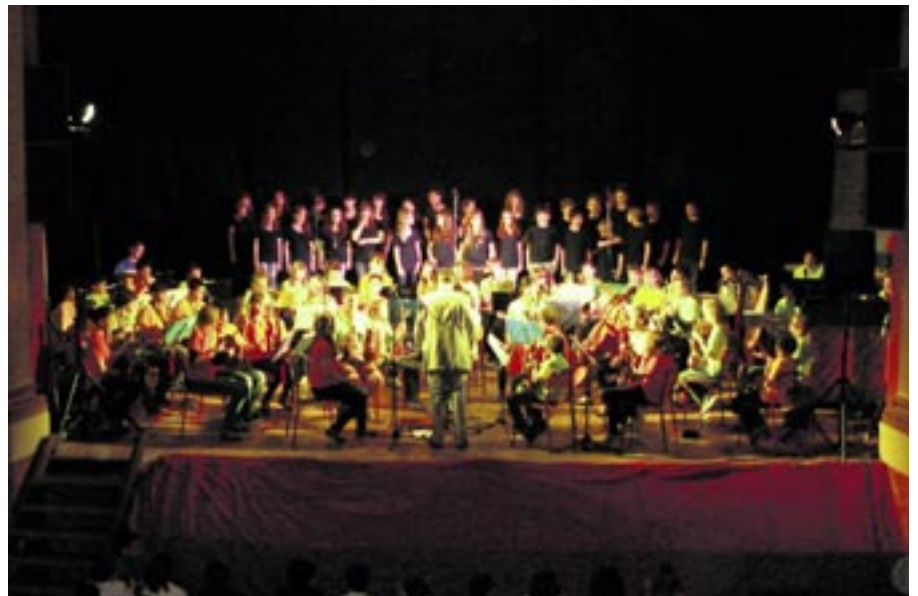
La chorale du collège des Terreaux s'est récemment produite sur la scène du Teatro Dante à Sansepolcro.

La chorale de l'école secondaire des Terreaux a donné à la mi-mai un concert à Sansepolcro et à Monterchi. Les élèves étaient accompagnés par 50 jeunes musiciens de l'orchestre du Conservatoire de Neuchâtel. Cette rencontre fait suite à la venue en 2010 à Neuchâtel de la chorale du Lycée secondaire de Sansepolcro dans le cadre des échanges réguliers entre les deux cités jumelées.