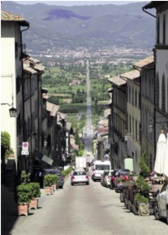
Au loin, la ville de Sansepolcro vue depuis la commune d'Anghiari.

La chorale de l'école secondaire des Terreaux a donné à la mi-mai un concert à Sansepolcro et à Monterchi. Les élèves étaient accompagnés par 50 jeunes musiciens de l'orchestre du Conservatoire de Neuchâtel. Cette rencontre fait suite à la venue en 2010 à Neuchâtel de la chorale du Lycée secondaire de Sansepolcro dans le cadre des échanges réguliers entre les deux cités jumelées.