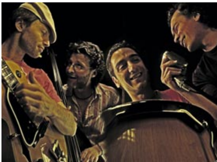
Le groupe I Skarbonari se produira vendredi 22 juin à 23 heures sur la grande scène de la Fête de la musique.

«La Loterie romande qui fête cette année ses 75 ans s'est associée à la Fête de la musique dans chaque canton romand», ont expliqué les organisateurs de la manifestation lors d'une conférence de presse. L'Association de la Fête de la musique a reçu 20'000 francs pour programmer des