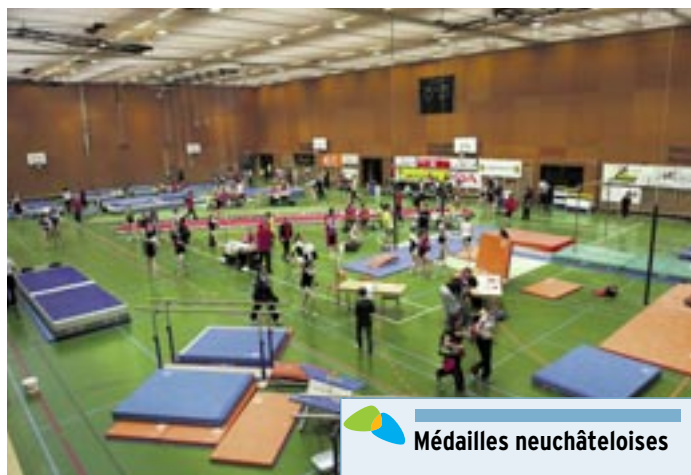
lieu samedi dernier à la Riveraine, à la Maladière et aux patinoires du littoral à l'occasion de la Fête romande de gymnastique 2012.