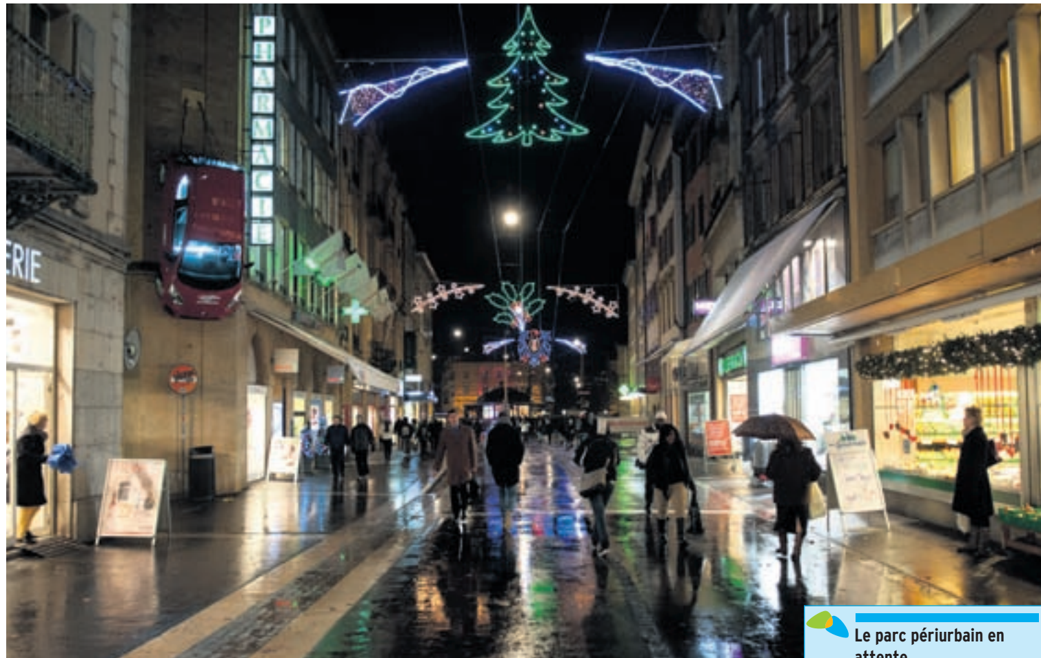
Viteos, les commerçants et les services de la Ville ont déployé des efforts tout particuliers afin que la cité brille pour les Fêtes de fin d'année.