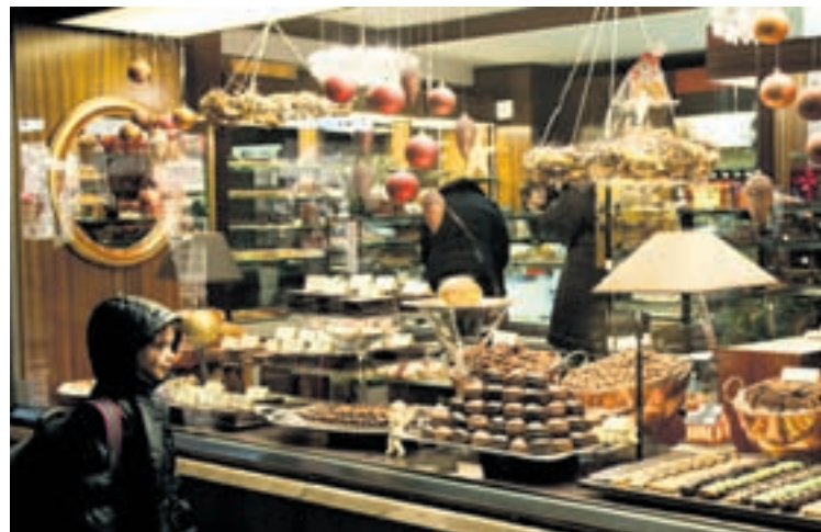
... Miam, miam

LE CAPITAL 3 e semaine. 12 ans sug. 16 ans. VF di 11h. Acteurs: Gad Elmaleh, Gabriel Byrne, Natacha Régnier. De Costa Gavras.