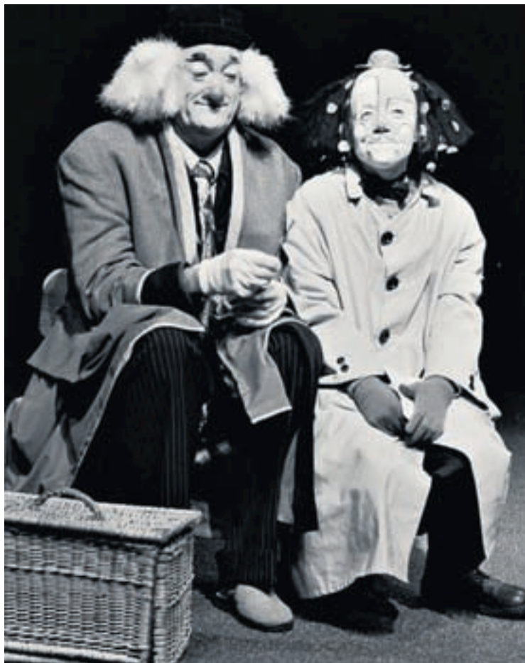
Zig et Arletti, deux clowns attachants et drôles, s'interrogent sur le sens de la vie dans «La curiosité des anges».

«Dans ce spectacle, on voit deux êtres humains, comme on voit les