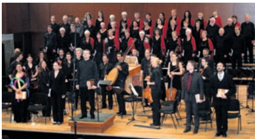
L'Ensemble Vocal de Neuchâtel entonnera ritournelles joyeuses et chants angéliques lors de son concert de Noël.

L'Ensemble Vocal de Neuchâtel donnera dimanche à la Collégiale un concert de Noël original, avec une création du compositeur neuchâtelois Steve Muriset, la «Ceremony of Carols» de Benjamin Britten et la «Cantate de Noël» de Ferenc Farkas. Les chanteurs seront accompagnés par l'ensemble instrumental Les Chambristes, l'organiste Humberto Salvagnin et la harpiste Aurore Dumas.