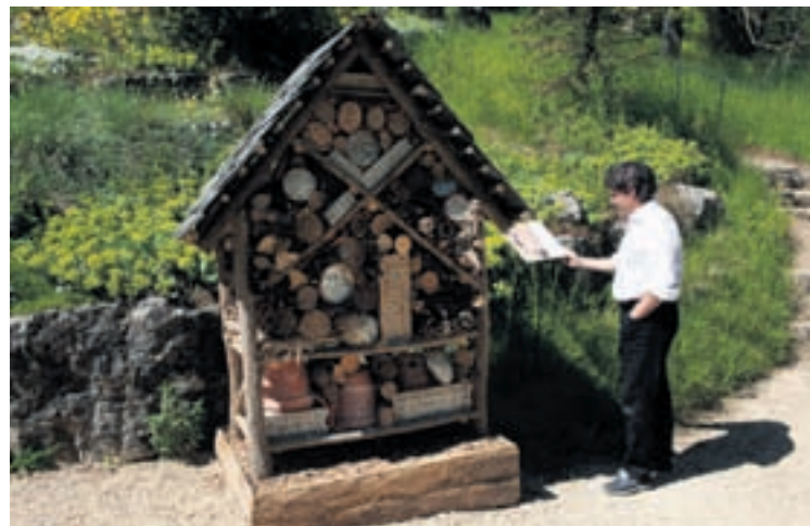
... l'hôtel des abeilles