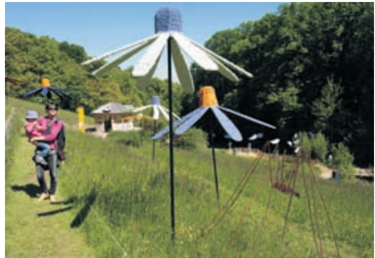
Le thème de la pollinisation des plantes par les abeilles est illustré par un champ de fleurs géantes pour donner l'impression au visiteur d'être une abeille.