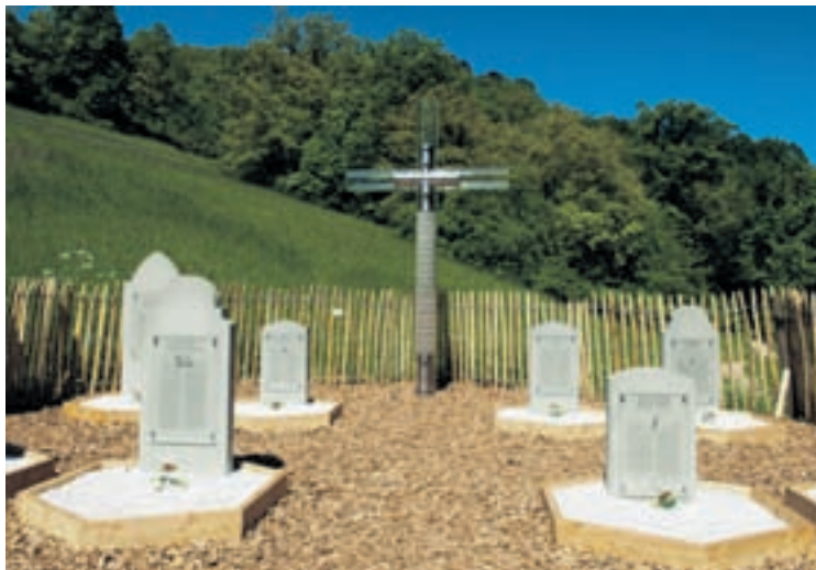
Ces huit pierres tombales évoquent les causes principales de la disparition et des maux qui touchent les abeilles.