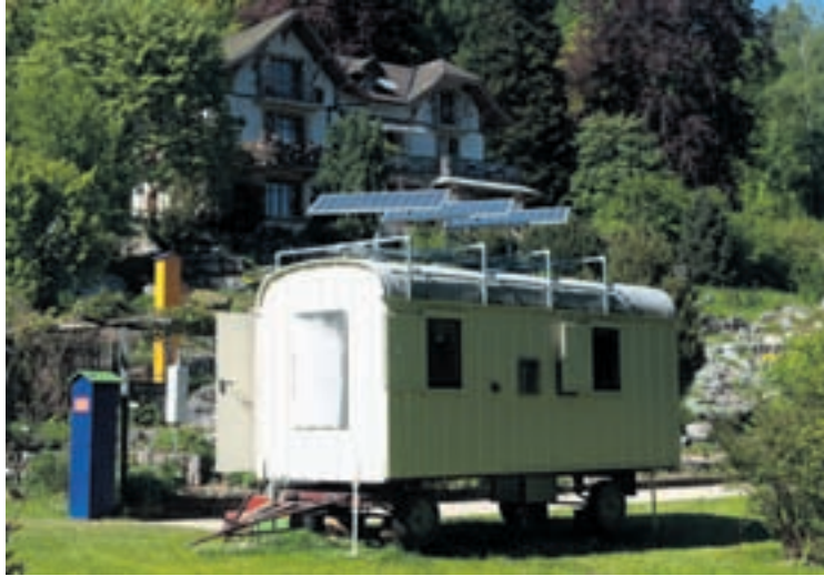
Dans cette roulotte, le visiteur découvrira la biologie des abeilles au travers de deux films, de loupes binoculaires et de nichoirs.