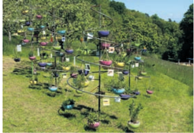
Une soixantaine d'espèces de plantes importantes pour les abeilles sont disposées dans ces grandes spirales de 3 mètres de haut.