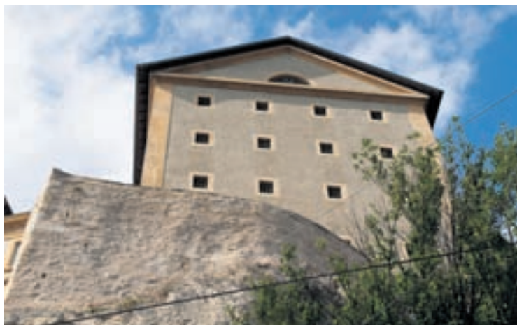
Le groupe Socialiste propose que les anciennes prisons (juste à côté de la Tour des prisons) soient réaffectées, notamment comme auberge de jeunesse.

présente motion en donner une supplémentaire à ceux qui en bénéficiaient initialement afin de, à nouveau, instaurer un «tarif préférentiel»? A quand la réduction qui permettra à ceux qui se voient à nouveau discriminés par ce tarif d'être ramenés à la situation paritaire qu'ils connaissent actuellement?