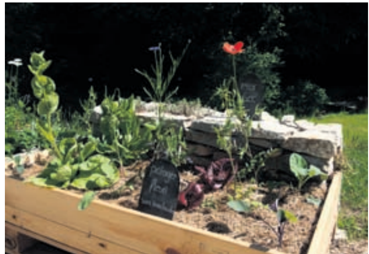
Une série de palettes donne des solutions au visiteur pour favoriser les abeilles dans son jardin ou sur son balcon.