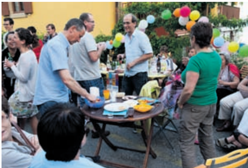
Pas moins de 5'000 personnes ont participé à l'édition neuchâteloise 2012 de la Fête des voisins, d'après les organisateurs.

Pour participer, les habitants de la ville de Neuchâtel sont invités à créer un événement avec leurs voisins. De la buanderie au jardin en passant par le salon, les voisins ont la possibilité de partager un petit-déjeuner, un repas canadien, une grillade, un apéritif ou tout autre moment convivial. Pour