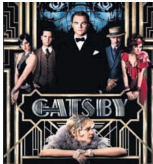
Leonardo DiCaprio incarne le fameux, le mystérieux, l'irrésistible, le magnifique Jay Gatsby.

«Gatsby le magnifique» se paye un casting de choix. Leonardo DiCaprio endosse le premier rôle. Le charisme et l'élégance de son