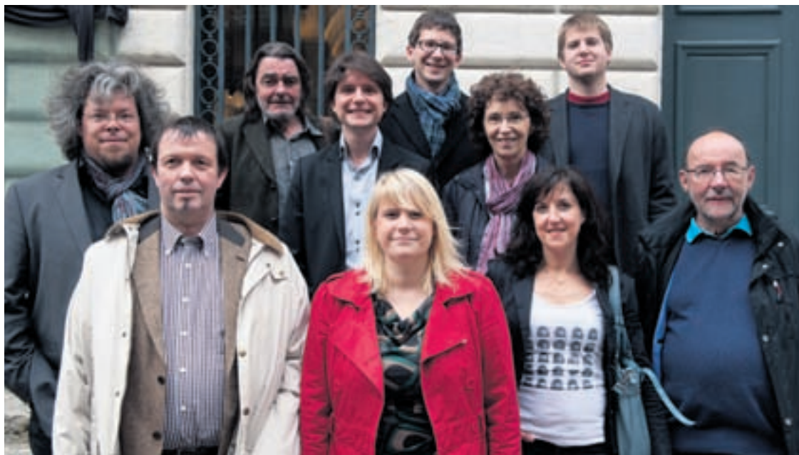
Le groupe socialiste estime qu'une suppression pure et simple de la taxe n'aurait pas été satisfaisante sans avoir certaines garanties.