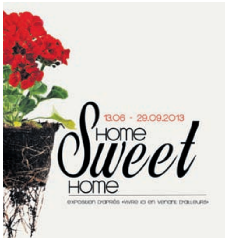
«Home sweet home» propose une réflexion basée sur 120 témoignages récoltés auprès de migrants.

L'équipe d'étudiants a sélectionné une série de témoignages, qu'elle a décidé d'explorer selon différents thèmes: le travail, la famille, les croyances, l'apparence, le déplacement et la com-