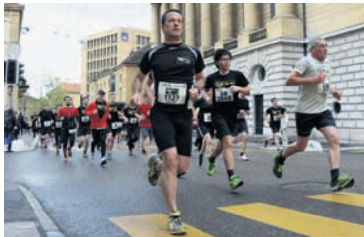
... le tour en ville