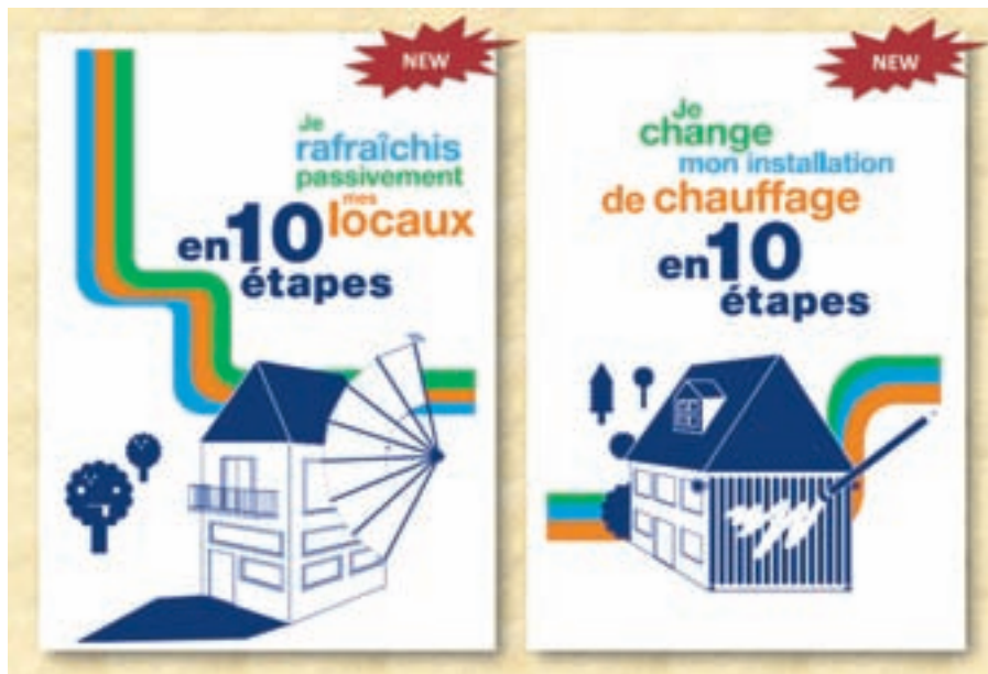
Les deux nouveaux guides pratiques « en 10 étapes ».

Cette prolongation permettra de mettre sur pied une formation pour les professionnels de l'énergie, afin de partager les connaissances et expériences acquises durant ce projet, et d'inviter le grand public pour une