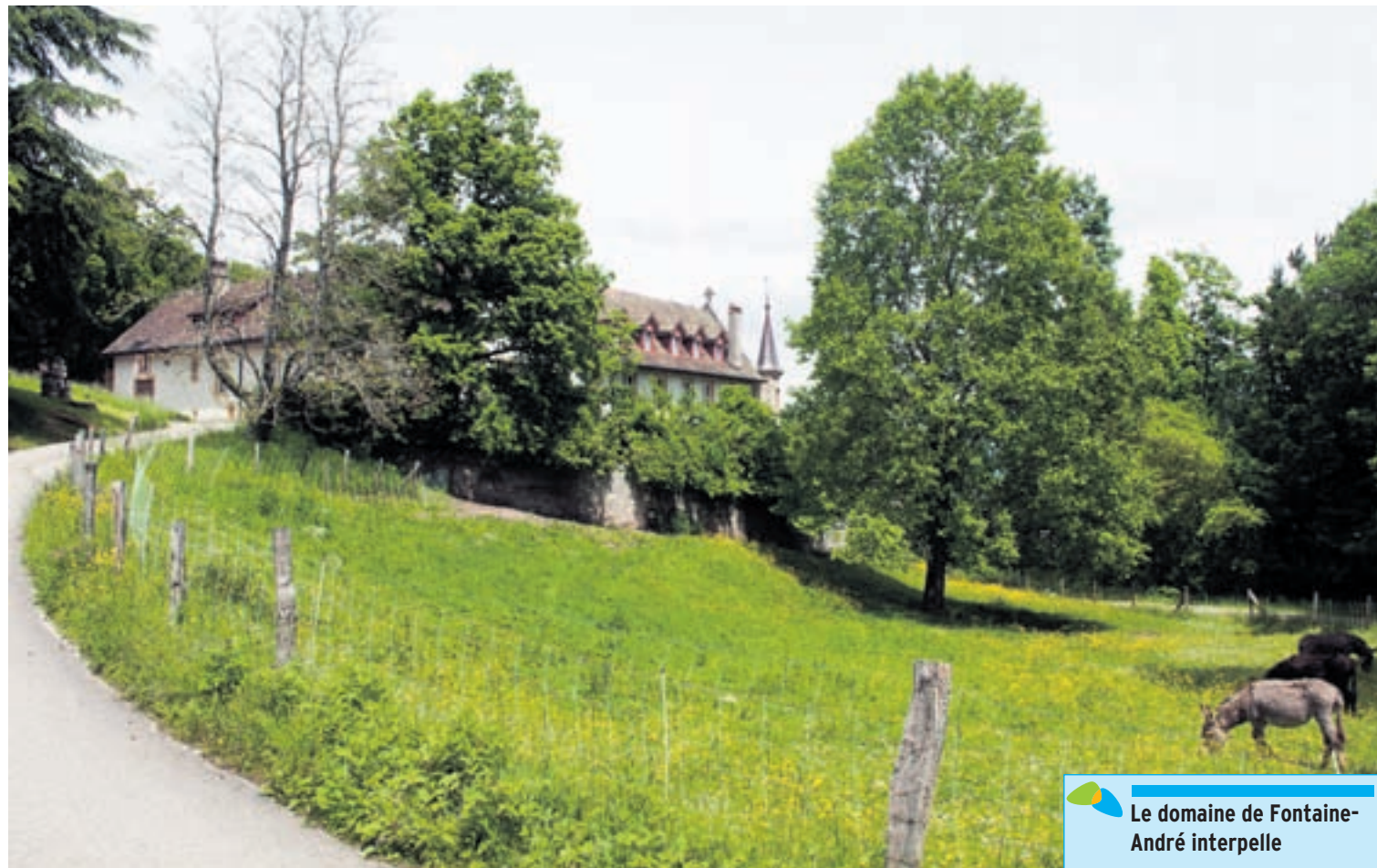
Le groupe PopVertsSol a interpellé le Conseil communal au sujet de la vente du domaine de l'Abbaye de Fontaine-André.