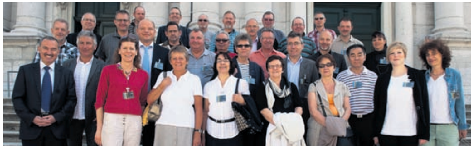
Les jubilaires de la Ville de Neuchâtel se sont rendus à Soleure. Il ont consacré un instant de la journée pour la traditionnelle photo-souvenir.