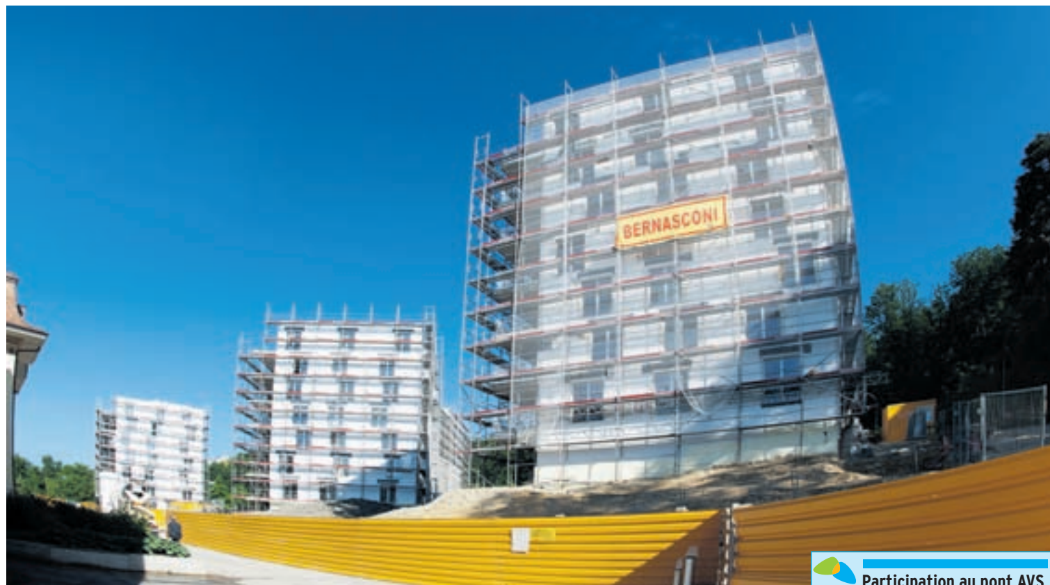
La Ville de Neuchâtel mettra en location au 1 er octobre 21 appartements à loyers modérés dans le nouveau parc résidentiel des Cadolles.

règlement d'aide à la personne pour les futurs locataires des Cadolles