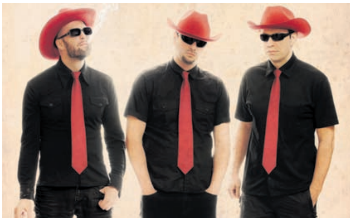
Le blues rock de Shas-Raal risque samedi soir de faire trembler les vieilles pierres du Neubourg.