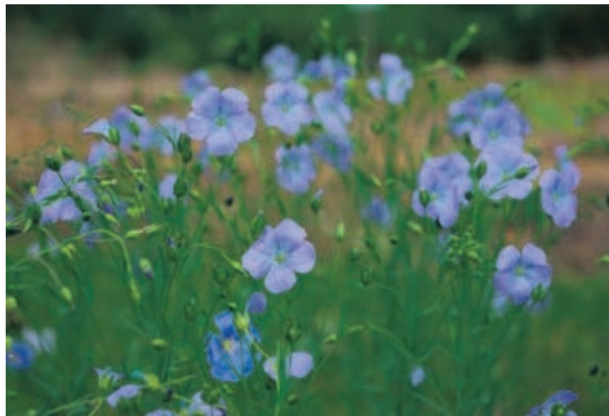
Quatre espèces du genre « Linum » et de la famille des Linacées ont été recensées dans la région de Neuchâtel. • Photo: Patricia Tutoy (Paris). Droits réservés

Le lin cultivé a été l'une des premières plantes domestiquées par l'homme. Il semblerait que la plus ancienne fibre végétale travaillée par l'homme soit du lin. Retrouvée dans une grotte de Géorgie, elle est vieille de plus de 36'000 ans. Dans notre région, des recherches archéologiques menées à Saint-Blaise ont permis de découvrir que le lin était déjà semé dans la région il y a plus de 4'500 ans. Il s'agissait de