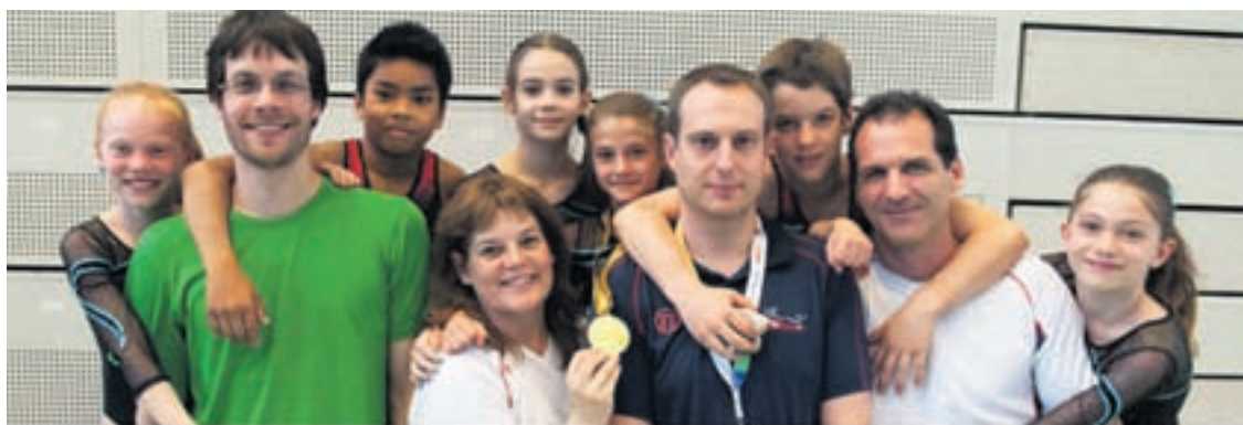
Les gymnastes des catégories P1 et P2 de Gym Serrières, entourés de leurs entraîneurs, lors du concours de gymnastique artistique de la Fête fédérale.