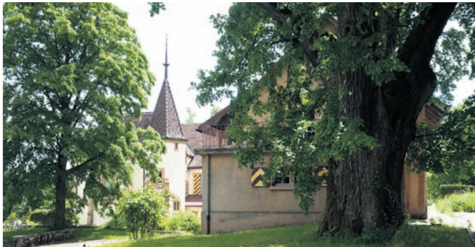
Le groupe PopVertsSol soutient la pétition qui demande l'acquisition par la Ville du domaine de l'Abbaye de Fontaine-André.