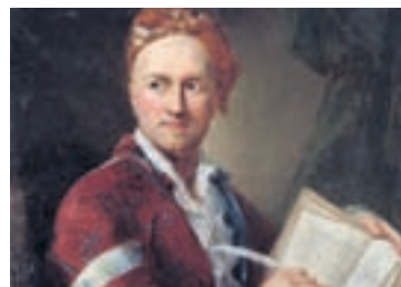
Emer de Vattel, huile sur toile, BPUN.