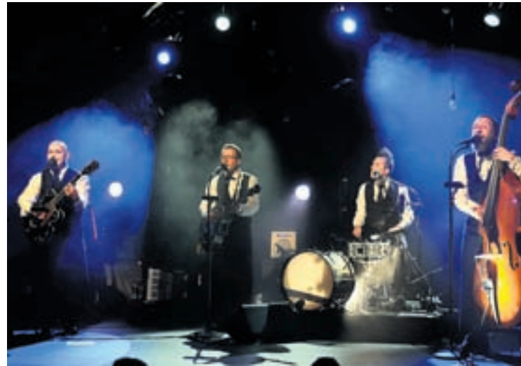
Les Petits Chanteurs à la gueule de bois se produiront à deux reprises à Neuchâtel dans le cadre de la Semaine de la langue française et de la francophonie.