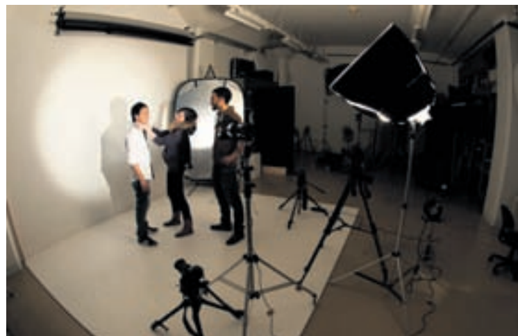
... clip publicitaire