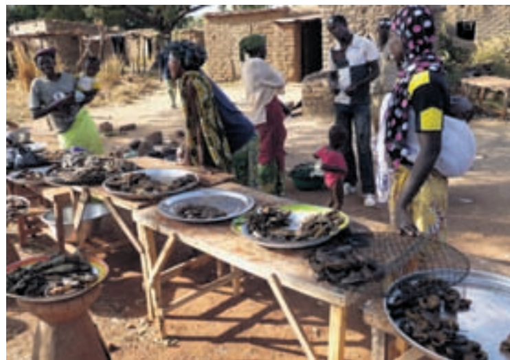
Marché de poissons séchés dans le village de pêcheurs de Souma.