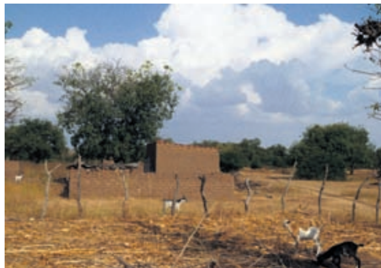
Paysage champêtre à proximité du village de Douroula.