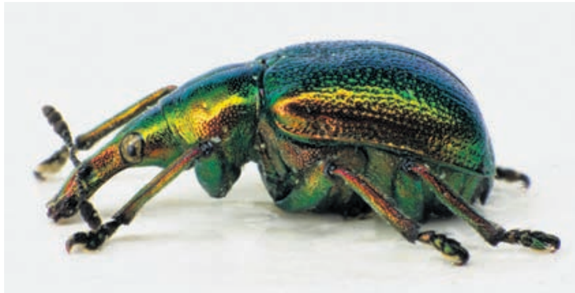
L'urbec (« Byctiscus betulae ») appartient à la famille des Atteblabidés.

Durant plusieurs siècles, ce charançon était le principal ennemi