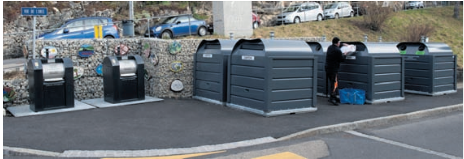
L'Association de quartier de la Côte a décoré le point de collecte situé à la rue de Fontaine-André dans les hauts de la ville de Neuchâtel.

L'Etat ainsi que les Villes de Neuchâtel et de La Chaux-de-Fonds ont récemment présenté un bilan réjouissant de l'introduction de la taxe au sac. Intervenue le 1 er janvier 2012, elle avait pour but principal d'améliorer le tri des déchets. Les autorités tirent leur chapeau aux citoyens qui jouent véritablement le jeu. En Ville de Neuchâtel, la récolte des ordures ménagères a diminué de 50,9% en passant de 8'914 tonnes en 2011 à 4'379 tonnes en 2012.