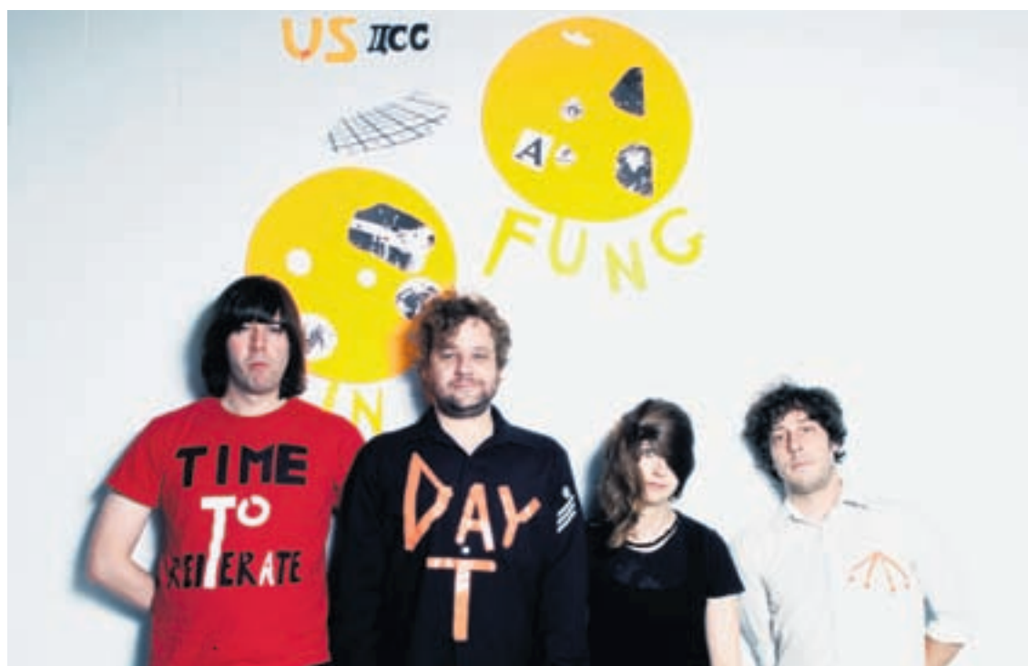
Le groupe canadien Duchess says déchaînera le public samedi 1 er juin à l'occasion de la 13 e édition de Festi'neuch.

Christine Gaillard Directrice de la jeunesse et de l'intégration