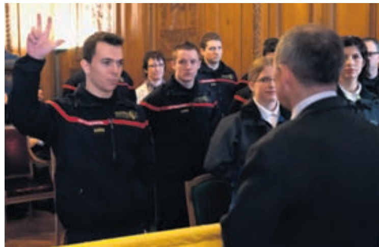
... prestations de serment