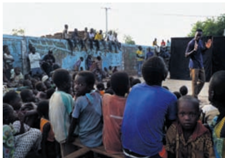
Spectacle de théâtre-forum de Douroula (travail de sensibilisation de la population sur les thématiques telles que le planning familial, l'hygiène, la santé, l'environnement, les institutions).