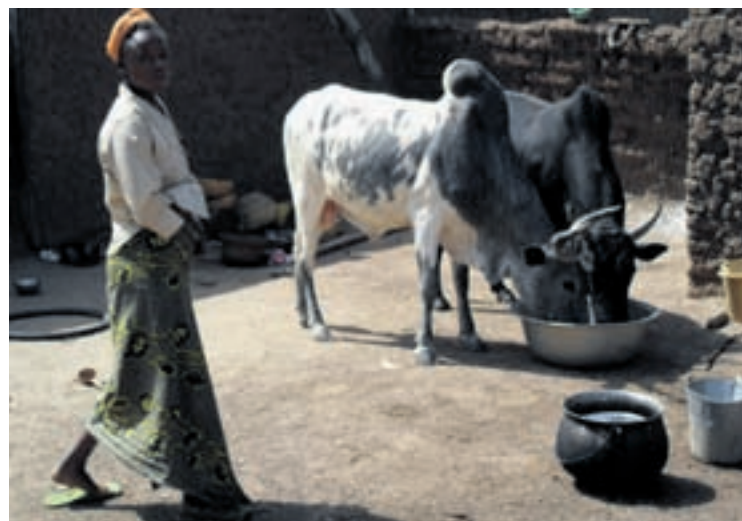
Dans la concession d'une famille d'éleveurs de zébus au village de Souma.