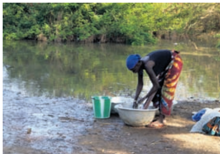
Lessive au bord du fleuve du Mouhoun, au village de Souma.