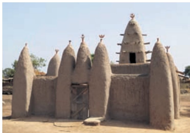
Mosquée du village de Sa, en banco (briques de terre crue).