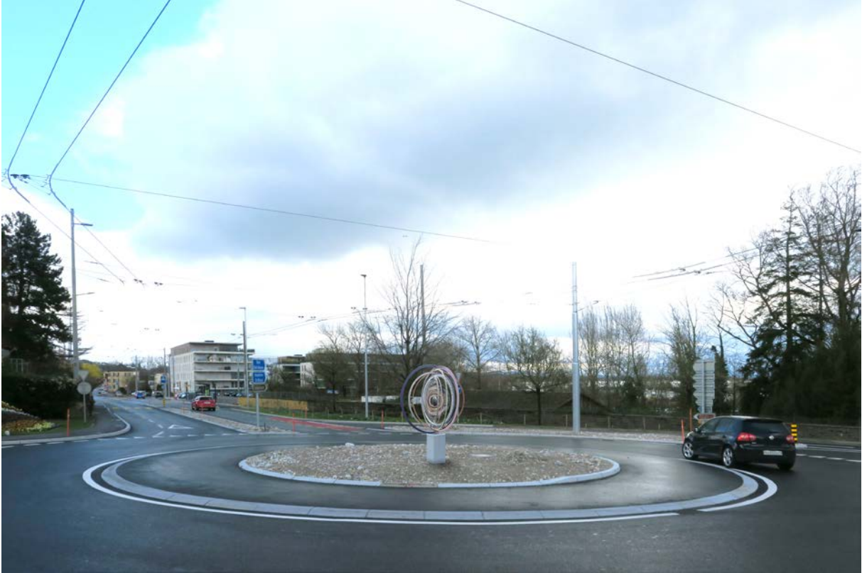
Illustration d'implantation de l'œuvre d'art au carrefour de Monruz (le noyau du giratoire sera aménagé de manière spécifique)

aménagement de par sa taille, sa géométrie et sa symbolique. Ce giratoire se trouve sur territoire de la Confédération, et l'Office fédéral des routes a validé la demande de la Ville. Sous réserve de l'approbation de votre Autorité, la sculpture pourra être installée durant l'été 2023.