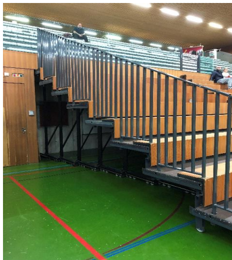
Barrières de sécurité actuelles

Près de 40 mises en place et rangements de la tribune sont effectués chaque année par les employés d'exploitation du Service des sports, ce qui représente plus de 100 heures de travail par année. Les barrières de sécurité situées aux quatre extrémités de la tribune et dont le poids global est de 800 kilos, doivent être installées manuellement avant chaque événement, puis sont retirées et rangées sous la tribune. Le type de barrières actuelles présente également l'inconvénient de réduire le champ de vision des spectateurs assis à proximité de celles-ci.