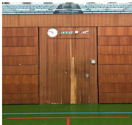
Porte d'accès centrale

Lorsque les gradins sont entièrement escamotés, ils forment une paroi entre 3 portes d'accès à la surface de jeu. Comme l'illustre la photo ci-après, les revêtements boisés sont fortement altérés et méritent aussi d'être assainis.