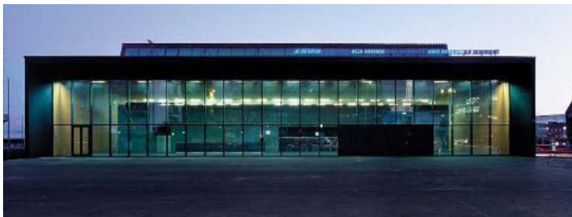
Façade nord de la halle de la Riveraine

La surface de jeu, très utilisée par les diverses associations sportives dans le cadre de championnats, de tournois et de galas, est endommagée à certains endroits et comprend un marquage qui n'est plus adapté aux exigences de la fédération nationale de volleyball.