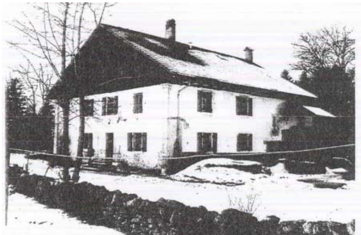
Figure 2 : vue du bâtiment à transformer en logements.

Une expertise établie par une Régie immobilière de la Ville a déterminé la valeur vénale des terrains vendus et des constructions à 700'000 francs. L'investissement nécessaire pour créer 4 grands appartements est de 400'000 francs. Les appartements sont très prisés à Chaumont. Le revenu locatif est estimé à plus de 60'000 francs par année, soit près de 6% de l'investissement total. Le crédit pour les transformations fera l'objet d'une demande ultérieure.