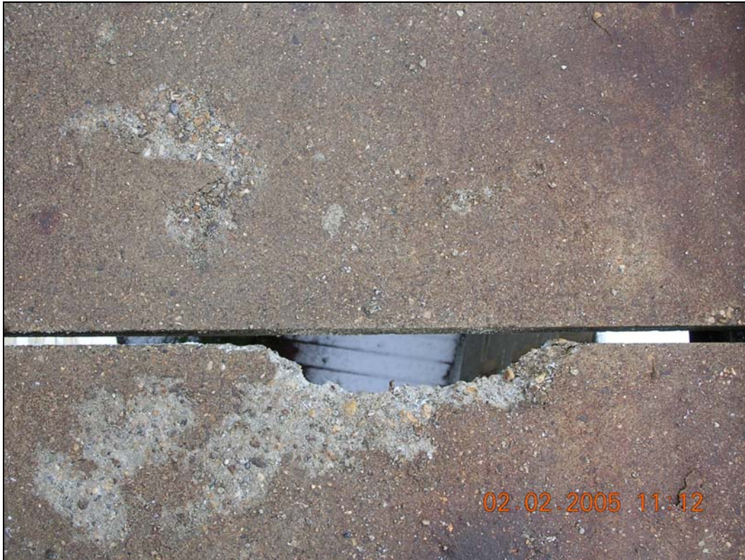
Etat des dalles