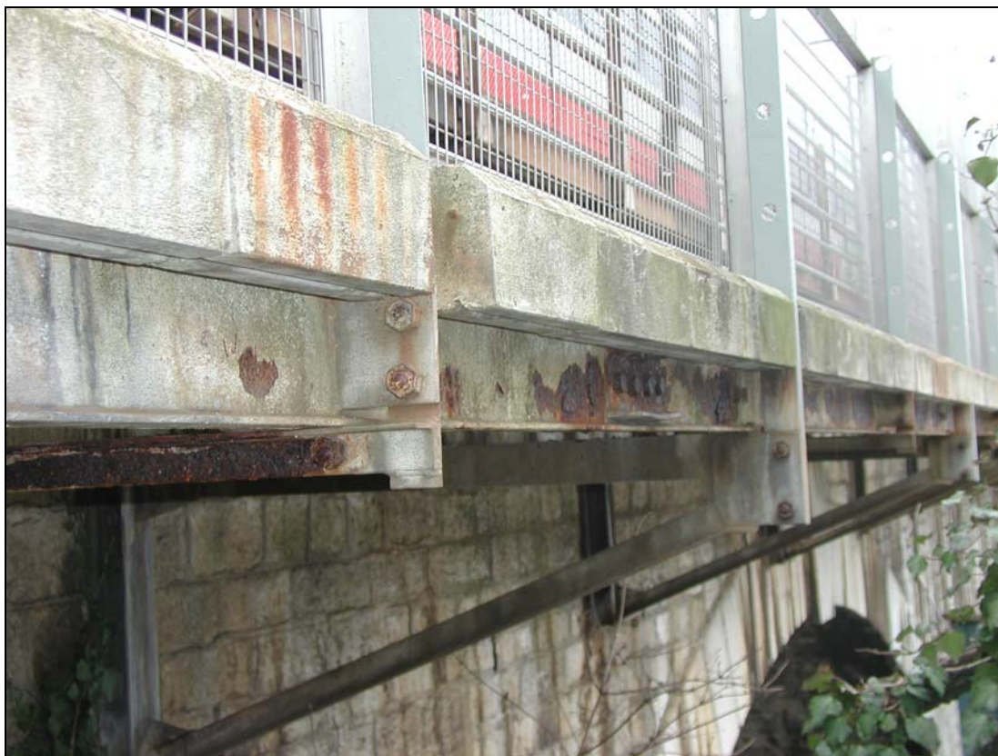
Usure générale avancée

Dans le prolongement de ces travaux, la passerelle présentant un état d'usure avancée, a fait l'objet d'une expertise au printemps 2005, qui conclut à la nécessité d'intervenir aussi bien sur son infrastructure que sur sa superstructure.