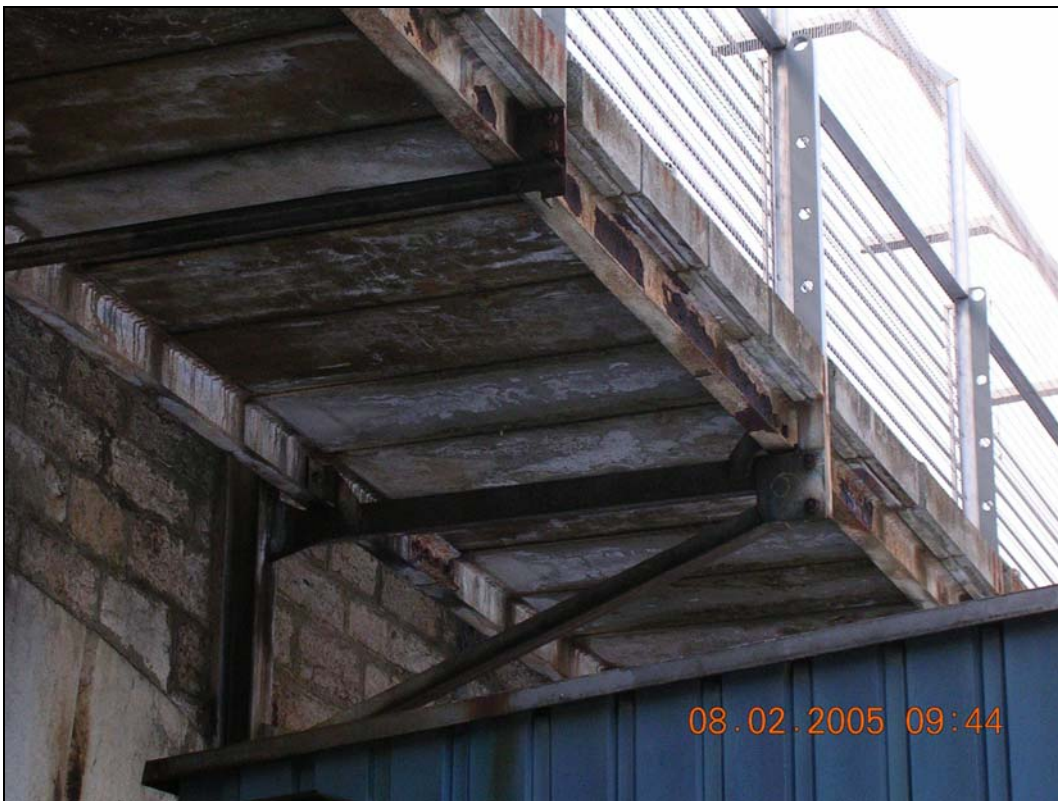
Consoles à changer