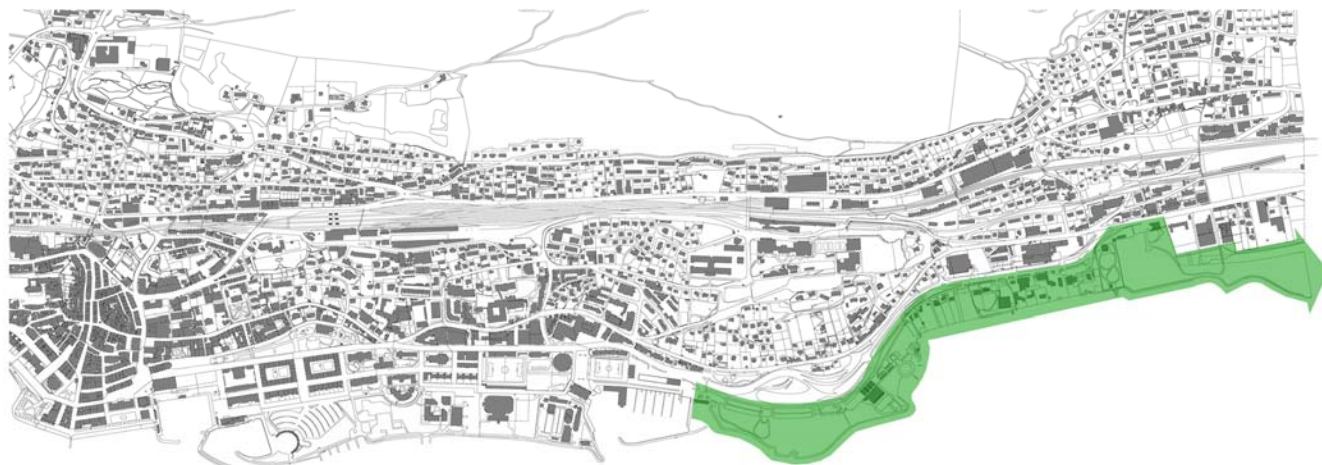
Illustration 1 : Secteur des rives entre le Nid-du-Crô et Monruz