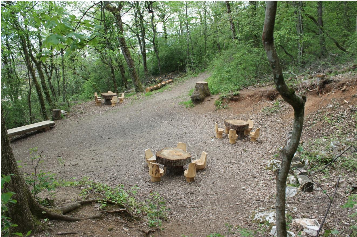
Espace d'accueil dans le Bois de l'Hôpital.

par le parc, et de proposer une information pour les visiteurs à l'aide de panneaux. Certains espaces d'accueil seront aménagés sur des sites déjà équipés d'infrastructures de délasserement tels que Pierre-à-Bot, Maujobia, Les Cadolles ou La Prise Gaudet. D'autres seront aménagés de toute pièce (Bois de l'Hôpital, etc.).