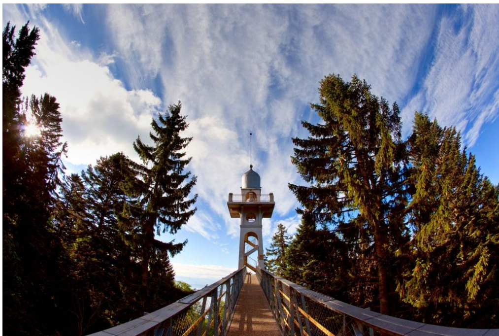
La tour de Chaumont, un élément culturel à valoriser dans le cadre du parc.