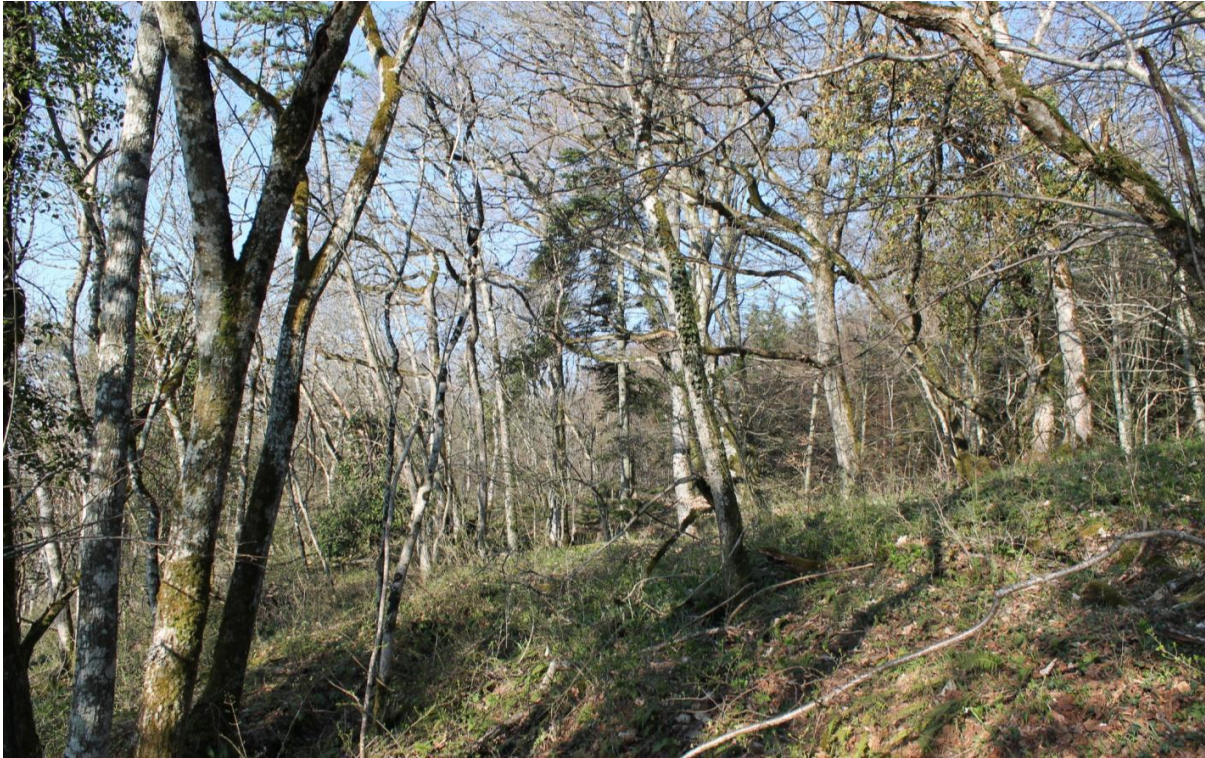
Chênaie entretenue très extensivement en vue de favoriser la biodiversité dans le Bois de l'Hôpital.