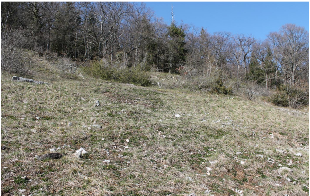
Les garides sont des milieux particulièrement riches en espèces mais qui doivent régulièrement être entretenus.