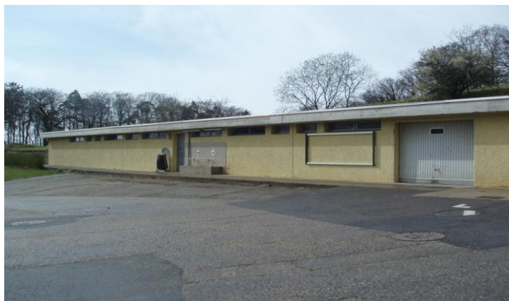
Les anciens vestiaires qui seront démolis

Le maintien de ce bâtiment à l'endroit actuel n'est pas judicieux ainsi que l'a démontré une étude confiée à trois bureaux d'architectes en 2011. Il apparaît préférable de démolir ces locaux et de les reconstruire aux abords du grand terrain naturel (voir plan annexé). Il importe de préciser que cette étude a été effectuée alors que Neuchâtel Xamax évoluait encore en Super League. Le cahier des charges remis aux architectes a été redimensionné pour tenir compte de la situation actuelle du club qui évolue en première ligue classique et qui ne dispose plus d'équipe M21.