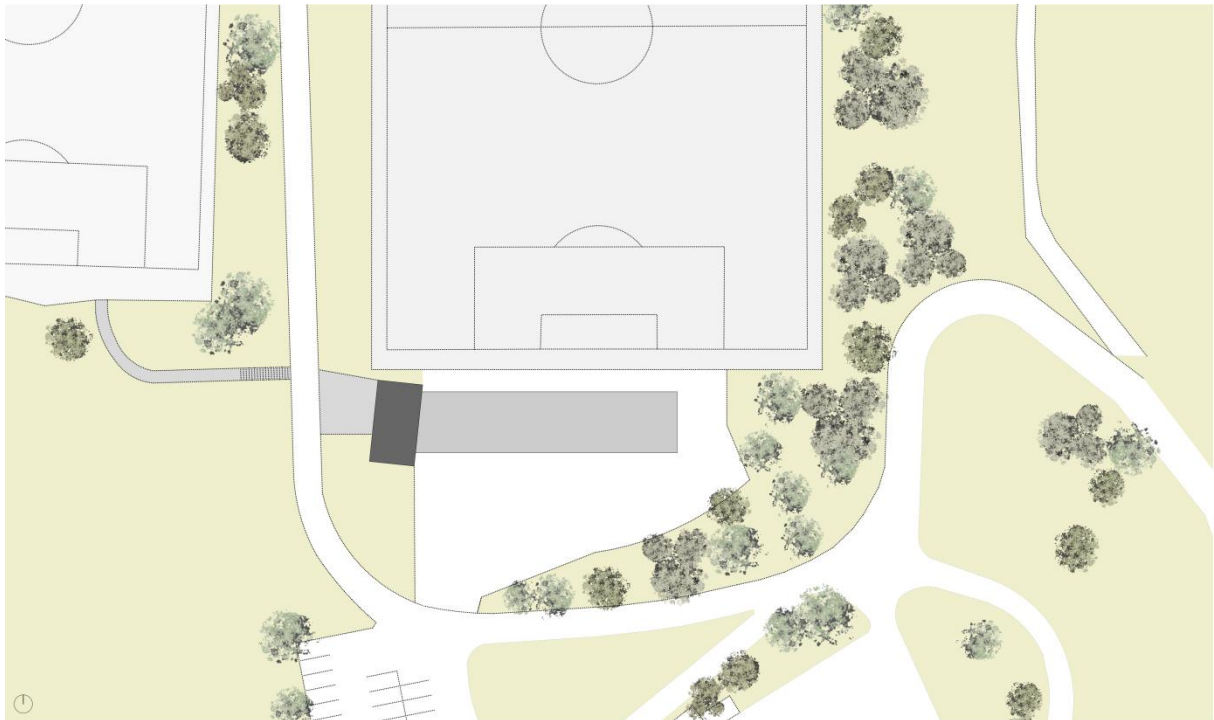
Vue d'ensemble de l'implantation du projet

L'espace laissé libre par les anciens vestiaires sera affecté au stationnement des véhicules des sportifs et spectateurs sur des places délimitées. Un tel parking en chaille fait défaut à ce jour, trente six places étant prévues.