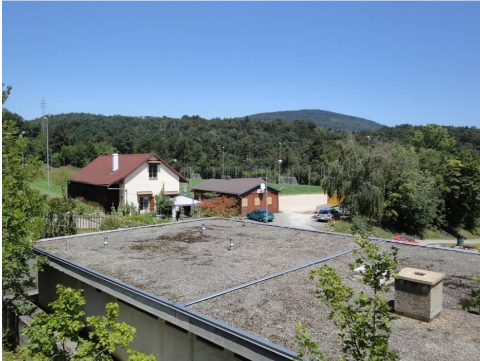
Vue d'ensemble du site avec les trois constructions qui seront démolies

L'espace laissé libre par les anciens vestiaires sera affecté au stationnement des véhicules des sportifs et spectateurs sur des places délimitées. Un tel parking en chaille fait défaut à ce jour, trente six places étant prévues.