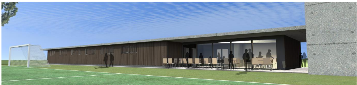
Vue de la façade côté nord (terrain) et répartition des locaux au rez-de-chaussée