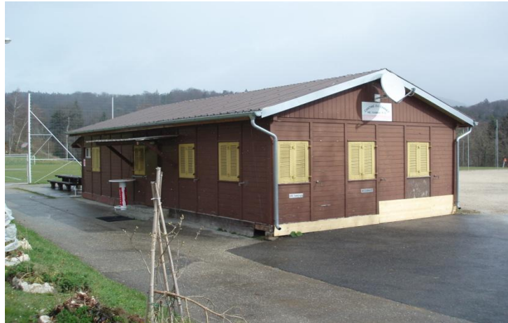
La baraque de chantier qui fait office de cantine sera elle aussi démolie

Enfin, à proximité du grand terrain de football, se trouve un atelier de ferblanterie inutilisé, vide et ne procurant aucun revenu locatif, qu'il est également prévu de démolir pour laisser place au nouveau bâtiment.