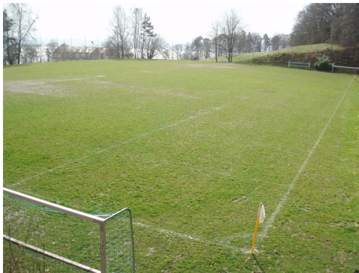
Le petit terrain sera agrandi pour répondre aux normes de l'ASF

Le grand terrain dont le revêtement est fait de gazon naturel, est en bon état et ne nécessite aucun investissement à moyen terme.