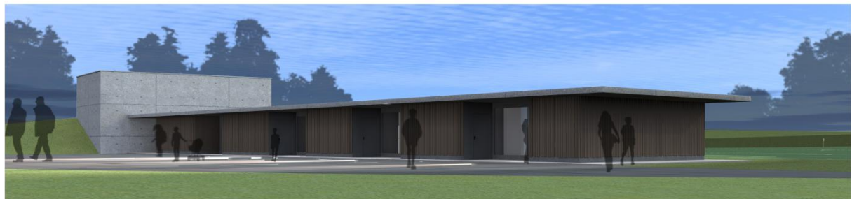
Vue de la façade côté sud (parking) et répartition des locaux au 1 er étage