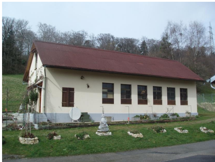
L'atelier de ferblanterie disparaîtra également au profit des nouvelles infrastructures

Enfin, à proximité du grand terrain de football, se trouve un atelier de ferblanterie inutilisé, vide et ne procurant aucun revenu locatif, qu'il est également prévu de démolir pour laisser place au nouveau bâtiment.