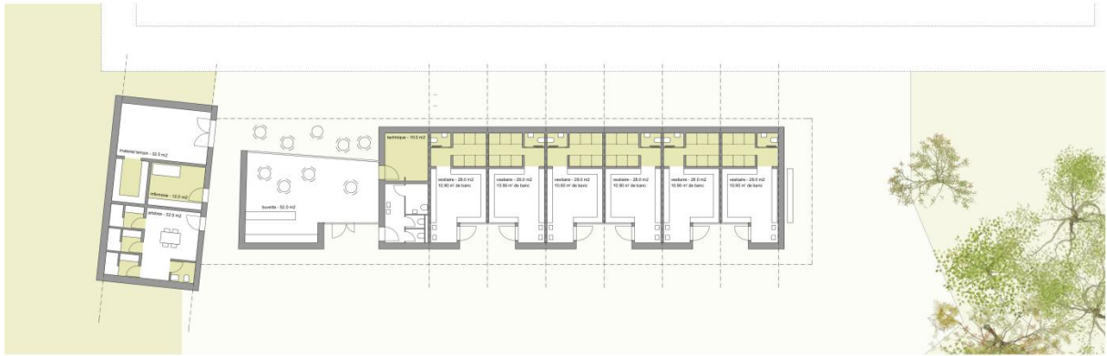
plan du rez-de-chaussée