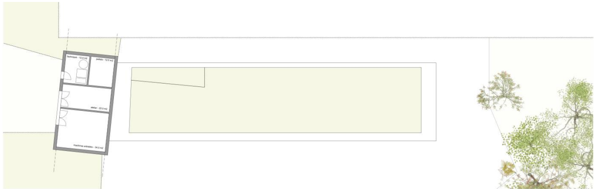
plan de l'étage