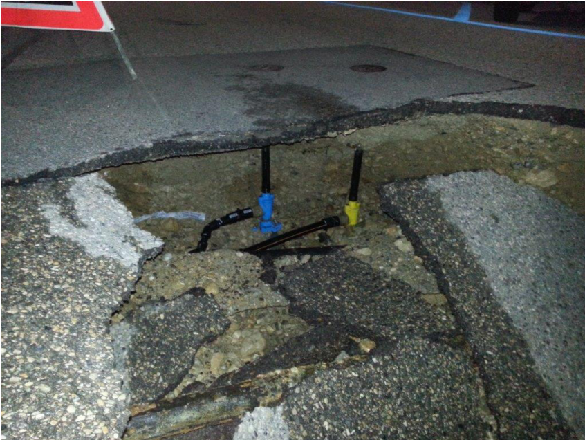
Dégâts, au droit de la fuite d'eau