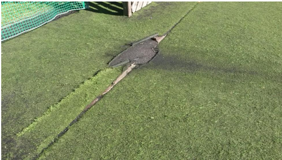
Agorespace des Acacias

Nous souhaitons recycler une partie de la pelouse du stade de la Maladière, celle qui ne présente pas de risque de blessures, afin de remplacer complètement la surface au sol de l'Agorespace de la place de sport de quartier des Acacias. Cette opération nous permettra d'éviter une dépense de l'ordre de 20'000 francs pour la réfection complète de cet aménagement sportif très utilisée par les jeunes du quartier. Un solde du revêtement de la Maladière sera au surplus stocké en réserve pour des réfections sur des places publiques.