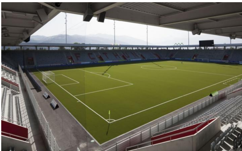
Stade de Thounne

En 2014, le stade de la Maladière présente un excédent de charges plus élevé que les deux exercices précédents en raison notamment de la recapitalisation de Prévoyance.ne, qui sur la masse salariale englobée au stade de la Maladière, a induit une charge complémentaire de 60'000 francs.