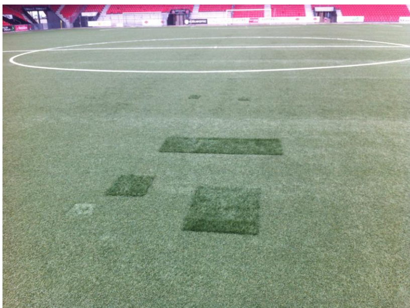
Pelouse de la Maladière

La pelouse de la Maladière a déjà subi de multiples réparations ponctuelles comme l'illustre la photo ci-dessous prise sur la partie centrale du terrain.