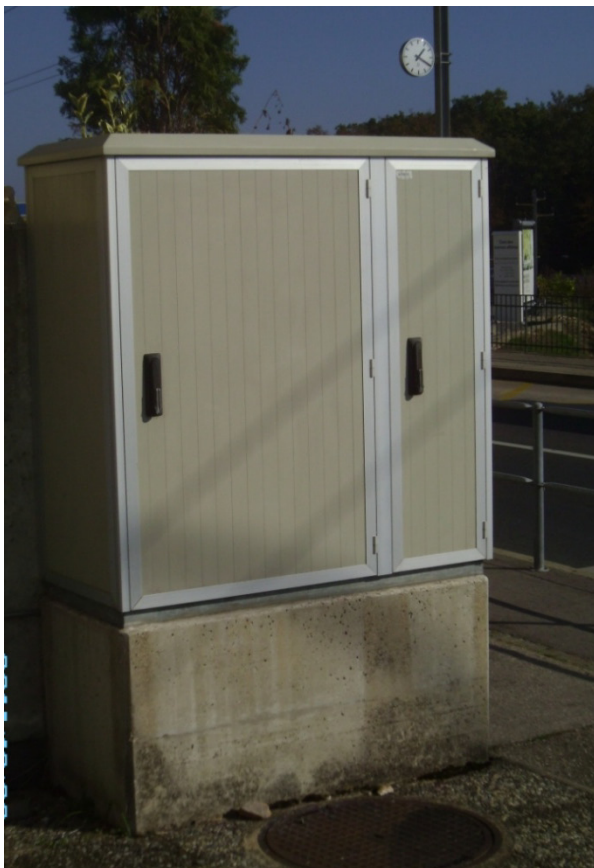
A : Armoire de commande