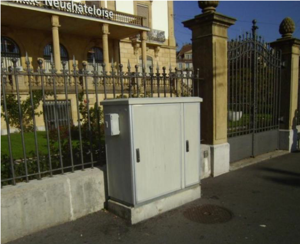
Armoire au sud de la BCN