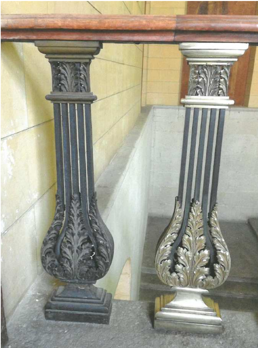
Figure 3. Les balustres dont les qualités intrinsèques seraient mises en valeur par une restauration.

Il s'agit de retrouver le lustre des balustres, l'éclat des peintures des murs et la patine des boiseries et autres éléments de ferronnerie et de mettre en évidence ce travail par un éclairage technique adéquat.