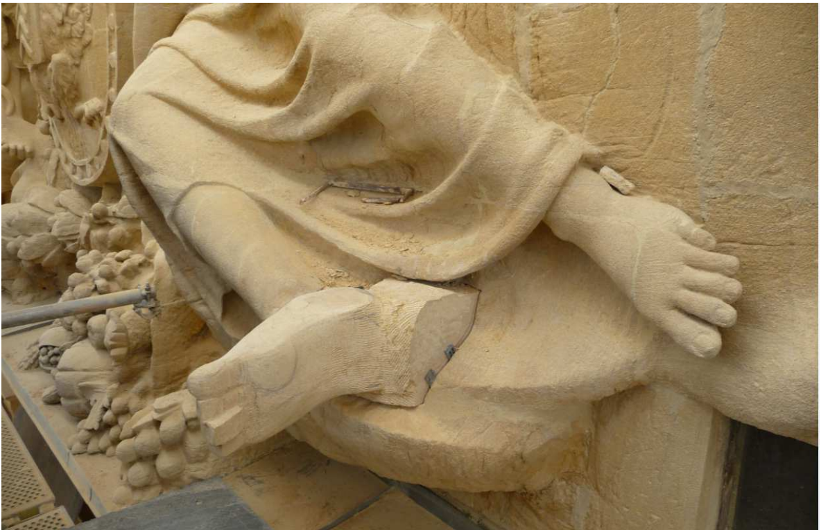
Figure 2. Fronton ouest. Avant et en cours de restauration.