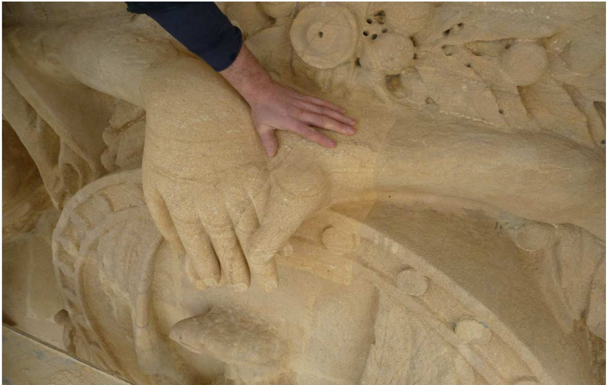
Figure 1. Fronton ouest. Avant et en cours de restauration.