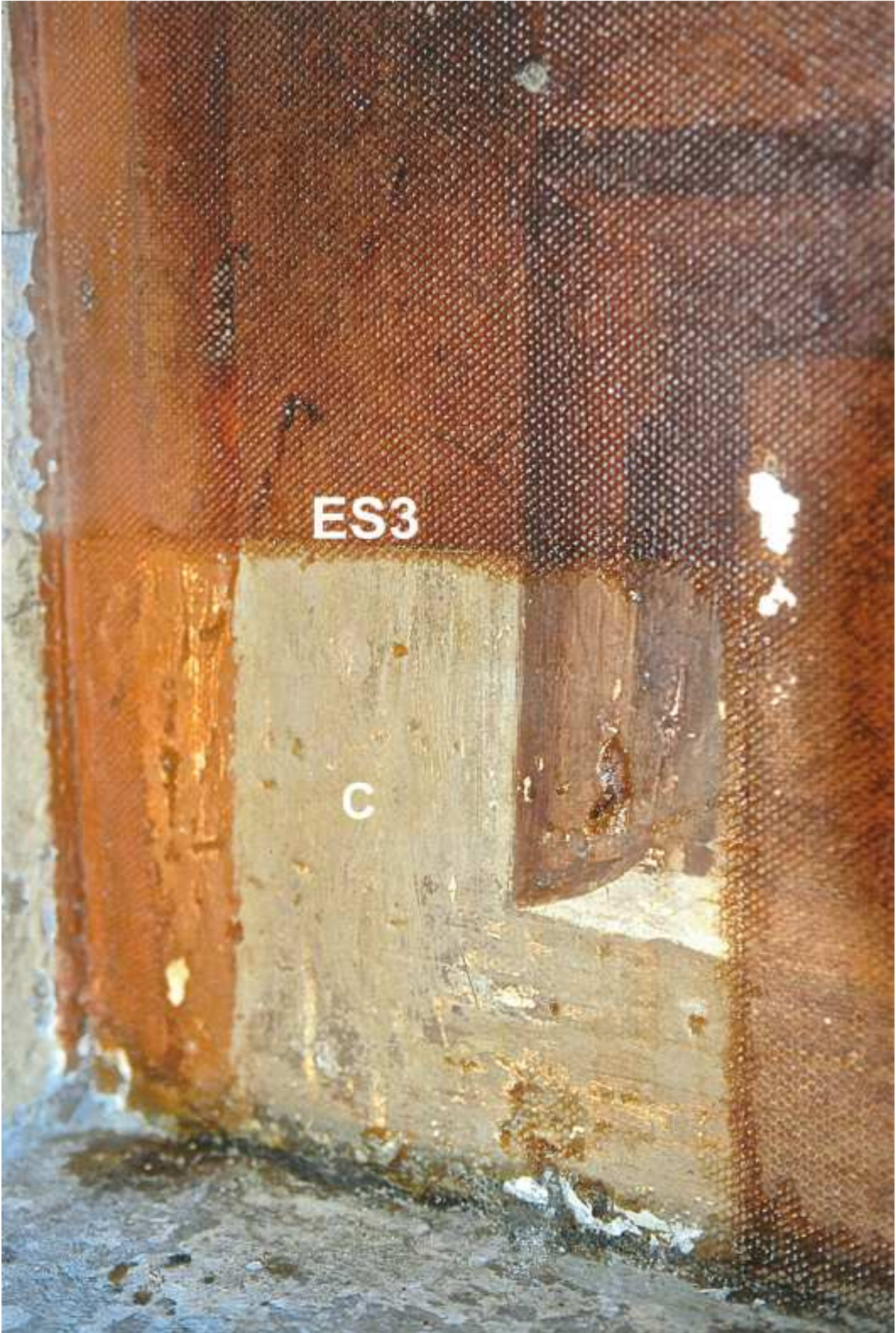
Figure 4. Suppression de la couche brunâtre et de la toile de maintien appliquée vers 1950. Mise à jour de la peinture murale en grisaille sur fond ocre clair.