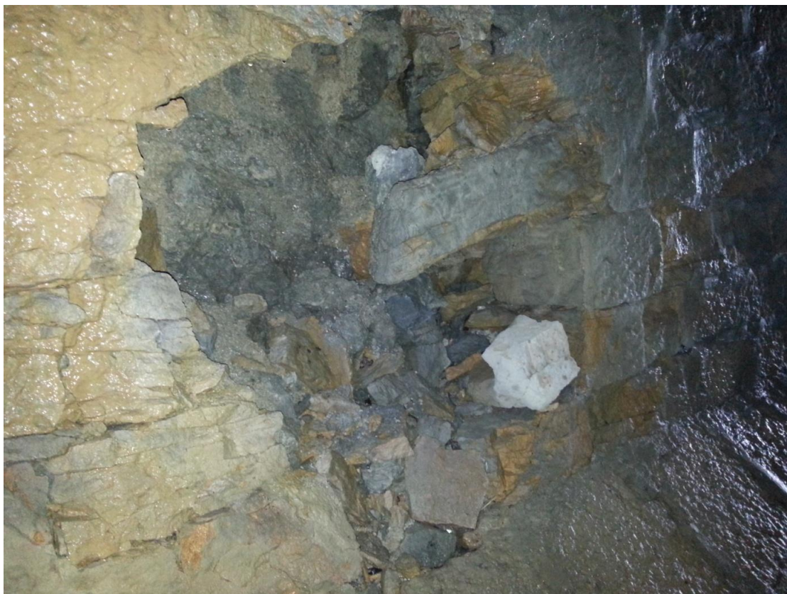
Exemple de dégâts dans la galerie du Seyon – éboulement dans le parement inférieur

Au-delà de ces travaux d'assainissement pressants, il s'agira de prévoir, lors des prochaines planifications financières, des mesures de consolidation sur les deux-tiers supérieurs de la galerie par la pose de blindages. Les investissements à planifier d'ici une dizaine d'années au plus tard, sont estimés à quelque 650'000 francs.