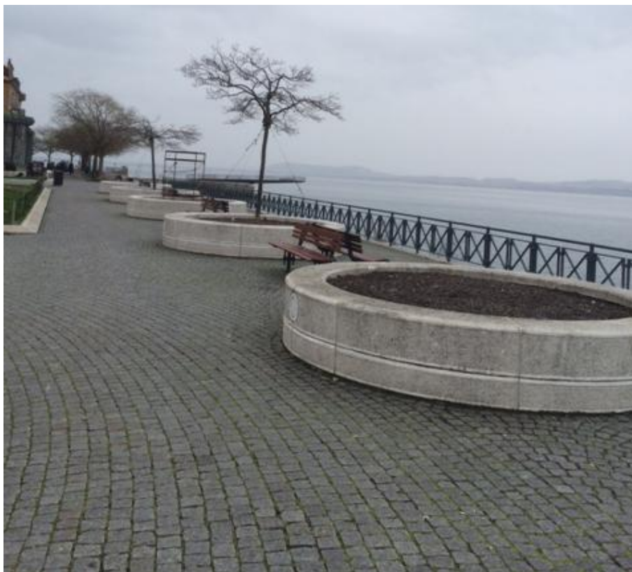
Etat actuel des arbres dans les bacs sur l'Esplanade du Mont-Blanc

Par ailleurs, les arbres installés dans les dix bacs situés le long du quai sud de l'Esplanade, en place depuis l'origine de l'aménagement du quai, doivent être changés dû à leur état sanitaire. Une partie des arbres a déjà été retirée ces dernières années. Le Service des parcs et promenades procédera prochainement à ces travaux. L'essence retenue sera à déploiement limité. Il s'agira notamment dans ce cadre de reprendre l'étanchéité de chaque bac en lien avec la dalle du parking souterrain de la place Pury. Le coût de ces travaux prévus en 2016, s'élève à 70'000 francs TTC.