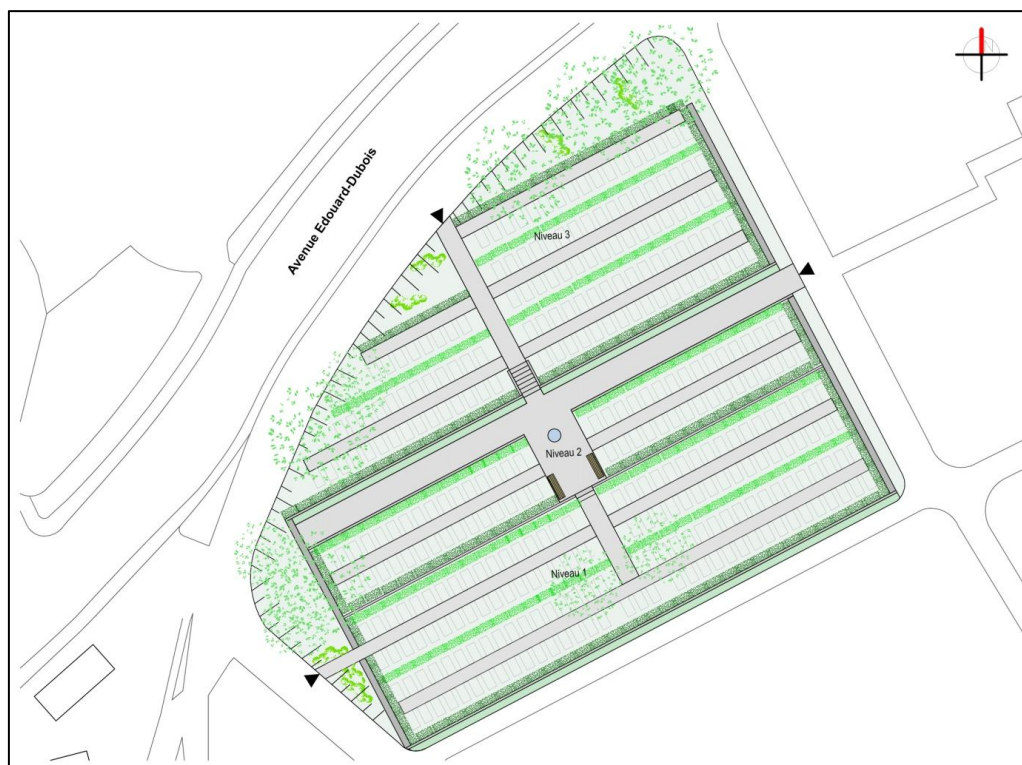
Principe d'aménagement du quartier A