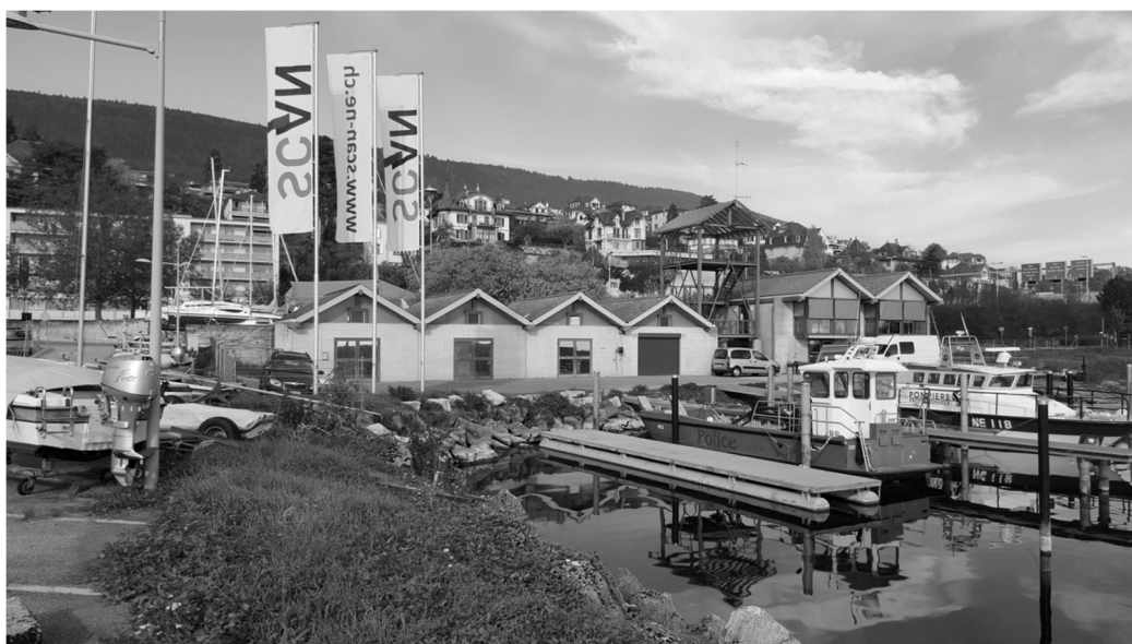
Figure 3. Vue depuis le lac

Le Service communal de la sécurité (SCS) utilise aujourd'hui 3 modules pour le sauvetage ainsi que pour le dépôt et l'entretien du matériel et un module pour le bureau du garde-port et son matériel courant. En contrepartie, la Ville assume une location de 6'000 francs par année et prend à sa charge les frais courants d'entretien pour 12'000 francs par an (chauffage, eau, électricité, conciergerie, etc.). Il n'occupe pas le bâtiment en Est, resté vide depuis le départ du SCAN.