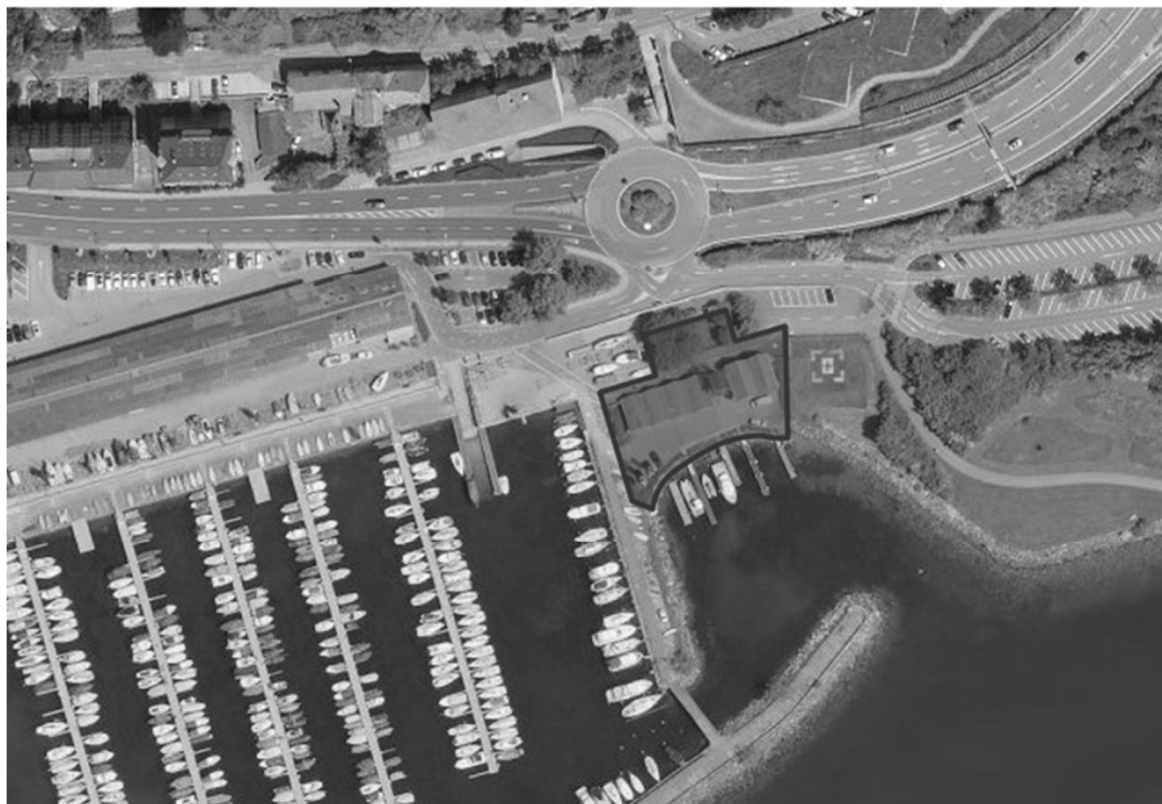
Figure 1. Plan de situation

Bien-fonds 16100, plan folio 221: «Route des Falaises», surface du bien-fonds 2'421m 2 , jardin 455 m 2 , accès-place 193 m 2 , enrochement 134 m 2 , droit de superficie (DDP) sur 1'639 m 2 pour le bâtiment du SCAN, échéant le 31.12.2060.